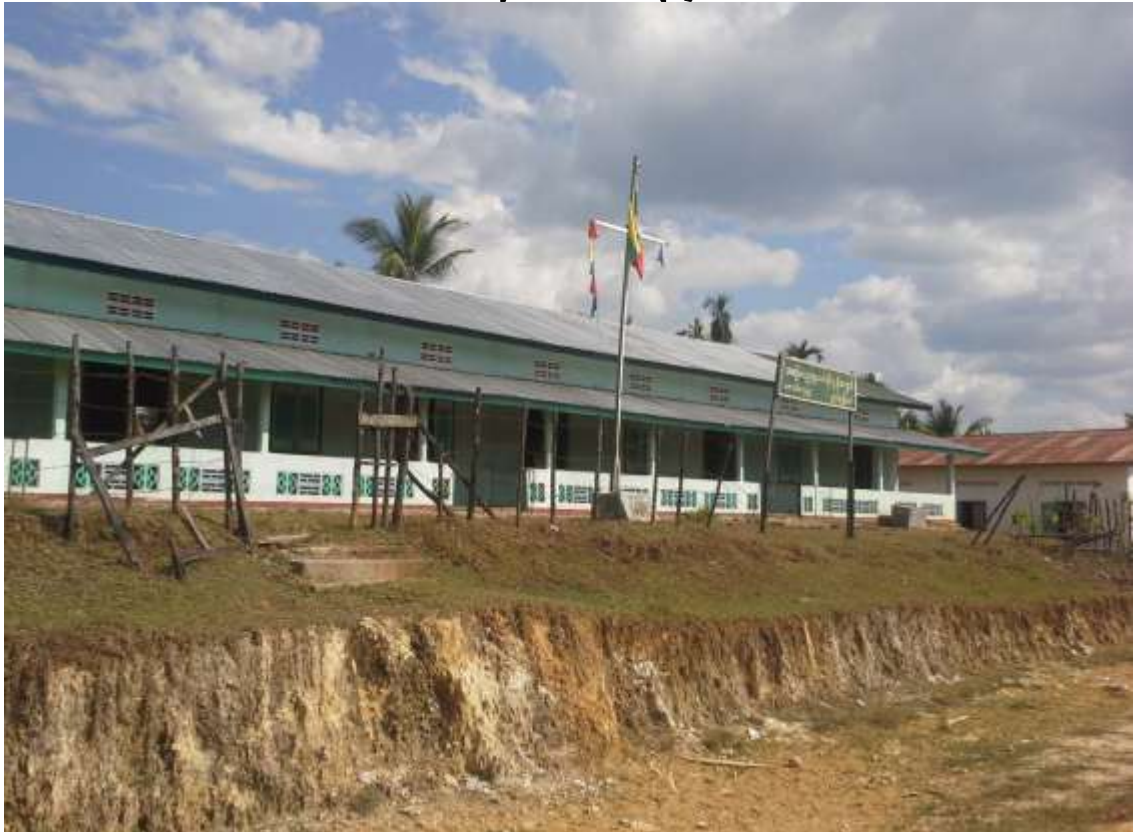
ကျောင်းခြံစည်းရိုး စီမံကိန်းပြုလုပ်မည့်နေရာ