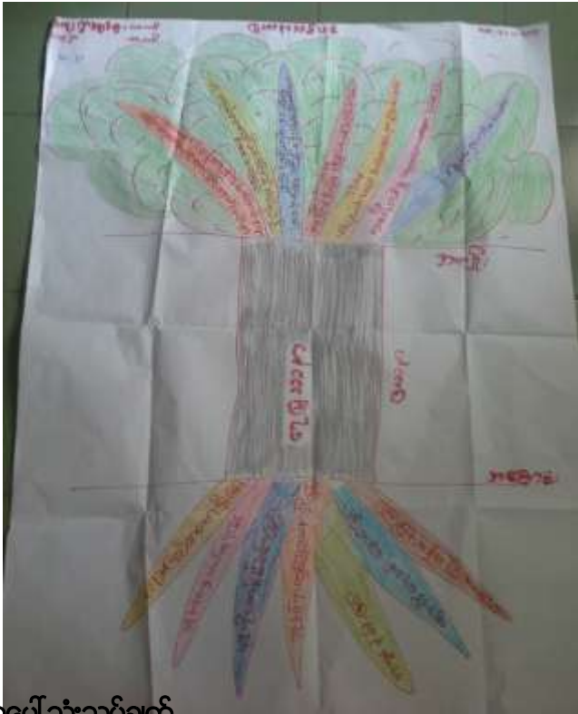
ပြဿနာသစ်ပင်များအပေါ်သုံးသပ်ချက်