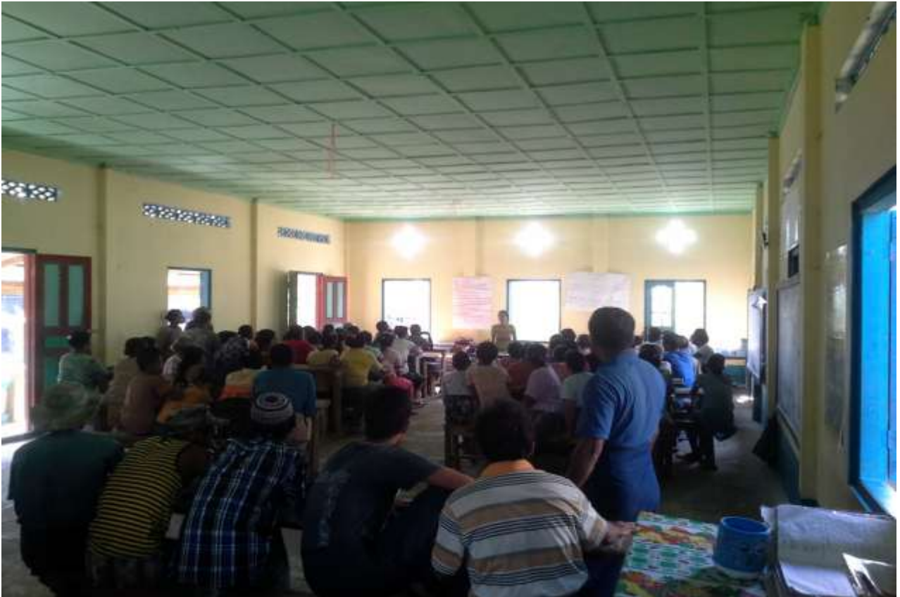
ပထမအကြိမ် ရွာလုံးကျွတ် အစည်းအဝေး