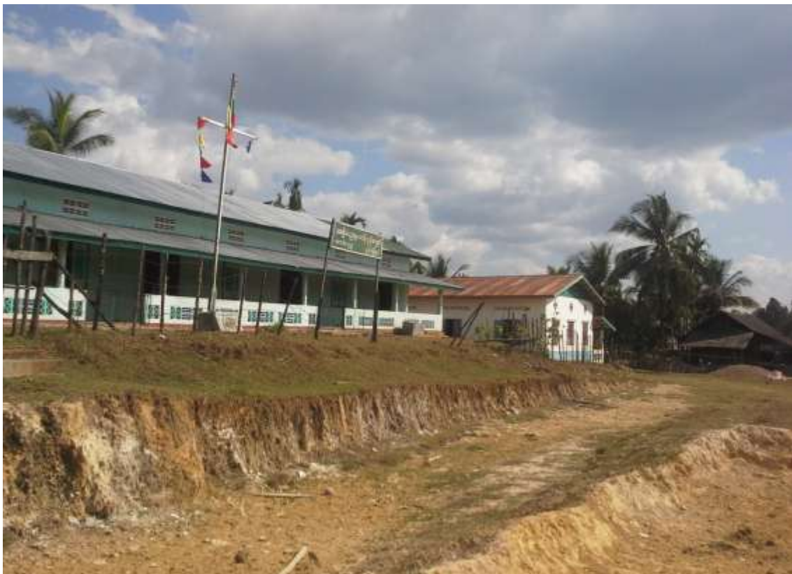
ကျောင်းခြံစည်းရိုး စီမံကိန်းပြုလုပ်မည့်နေရာ