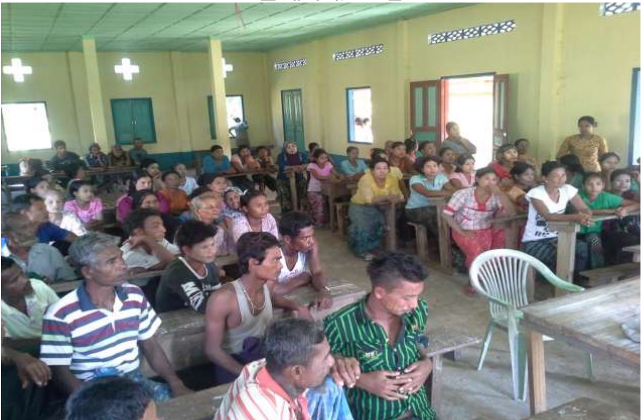
ပထမအကြိမ် ရွာလုံးကျွတ် အစည်းအဝေး