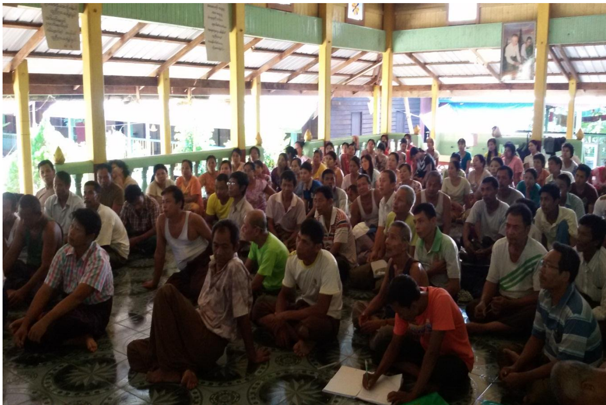
ပထမအကြိမ် ရွာလုံးကျွတ် အစည်းအဝေး