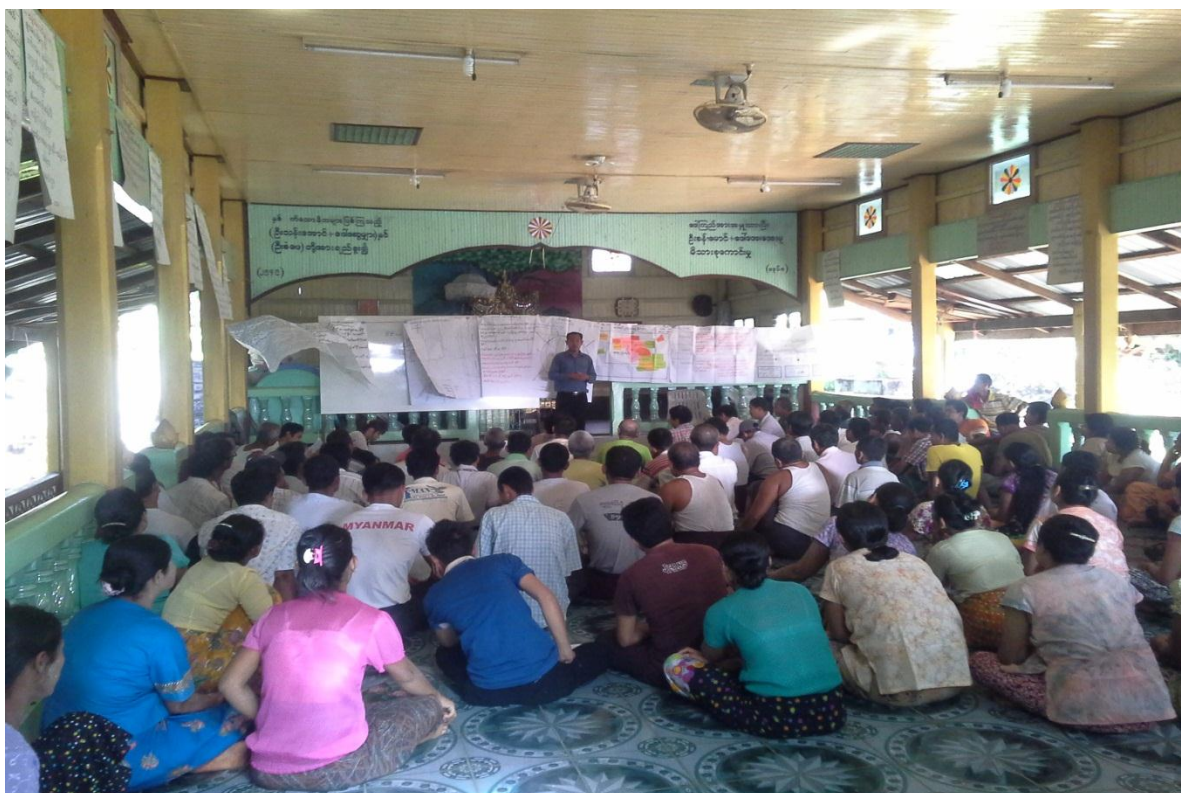
ဒုတိယအကြိမ် ရွာလုံးကျွတ်အစည်းအဝေး