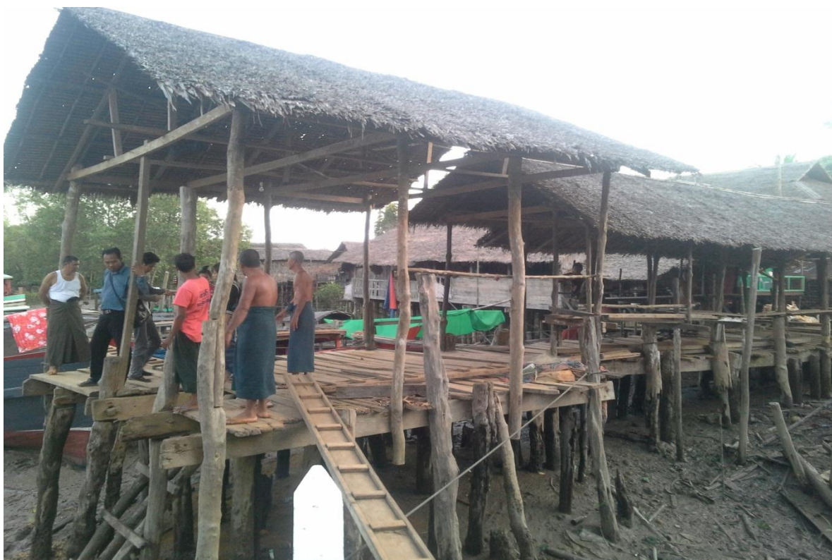
ဒုတိယအကြိမ် ရွာလုံးကျွတ် အစည်းအဝေး