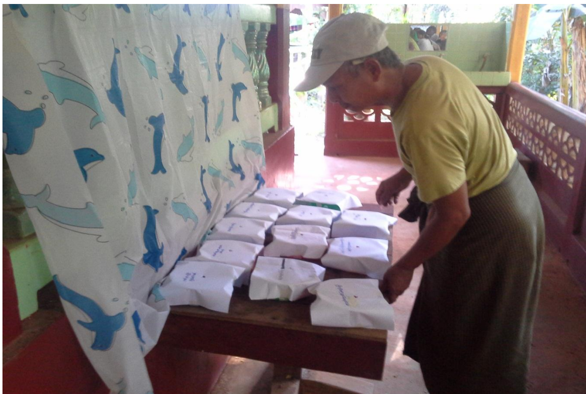
စိမံကိန်းလုပ်ငန်းခွဲအား လျှို့ဝှက်မဲပေးစနစ်ဖြင့် ရွေးချယ်ခြင်း