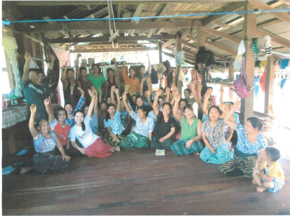
ကျေးရွာဖွံ့ဖြိုးရေးအစီအစဉ်ဆောင်ရွက်မှုမှတ်တမ်းဓါတ်ပုံများ