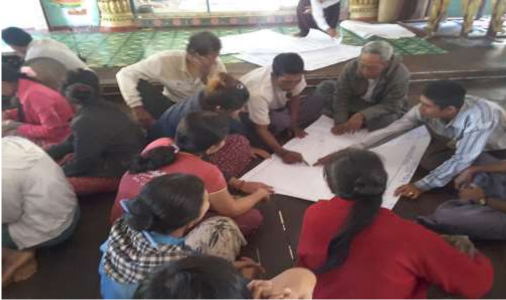
သာပေါင်းမြို့နယ်၊ ငဝန်ဒေါင့်ကြီးကျေးရွာအုပ်စု၊ ပိန္နဲချောင်းကျေးရွာ PRA Tools များ ပြုလုပ်ပုံ