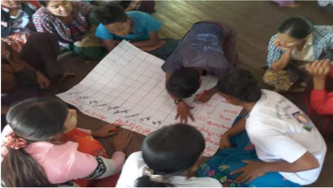
သာပေါင်းမြို့နယ်၊ ငဝန်ဒေါင့်ကြီးကျေးရွာအုပ်စု၊ ပိန္နဲချောင်းကျေးရွာ PRA Tools များ ပြုလုပ်ပုံ