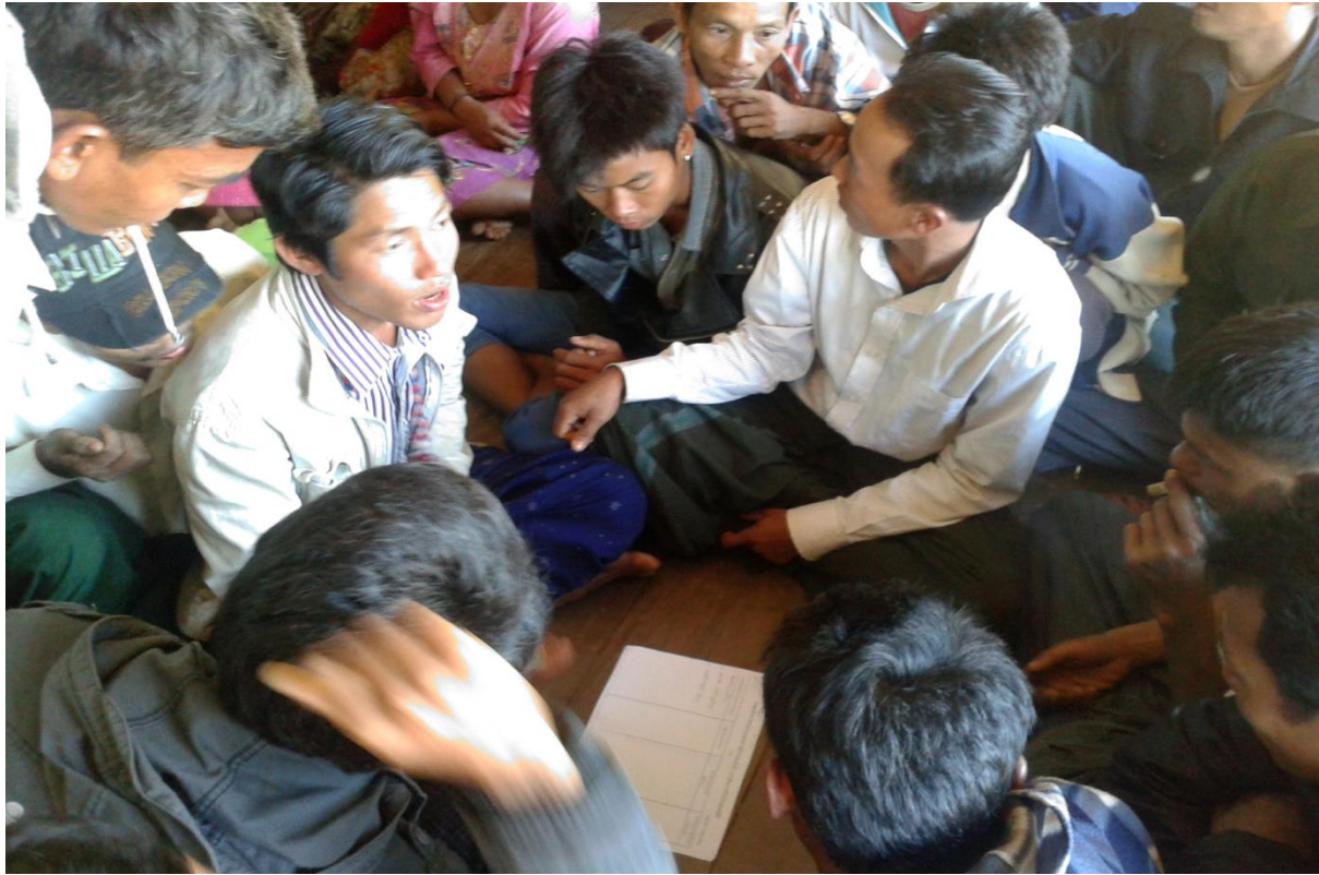
၂၀။ ကော်မတီဝင်များရွေးချယ်ခြင်းနှင့် ကျေးရွာဖွံ့ဖြိုးရေးအစီအစဉ်ဆောင်ရွက်မှုမှတ်တမ်းခါတ်ပုံများ