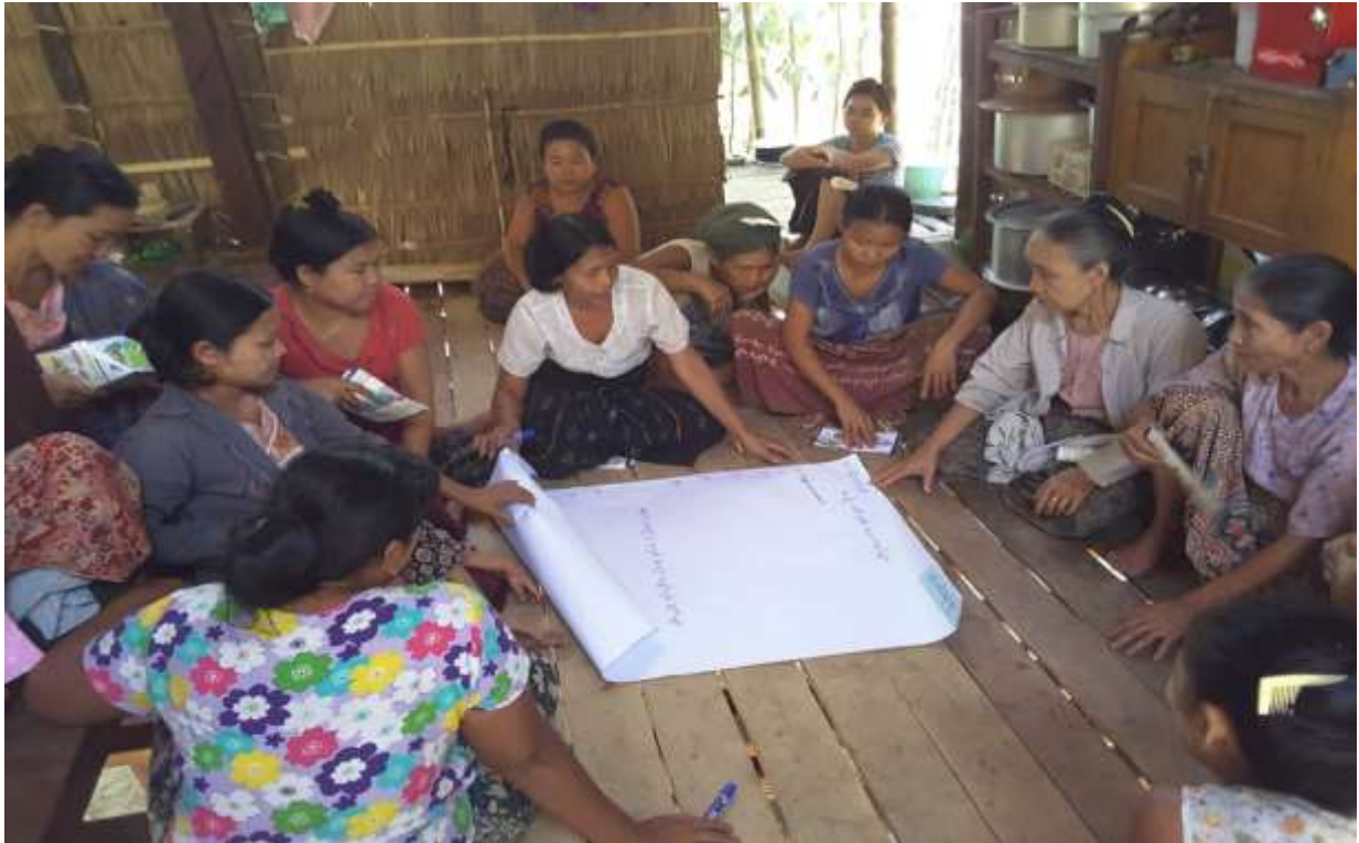
သာပေါင်းမြို့နယ်၊ ကင်းတပ်ကျေးရွာအုပ်စု၊ နဂါးအိုင်ကျေးရွာတွင် အစည်းအဝေးပြုလုပ်ပုံ