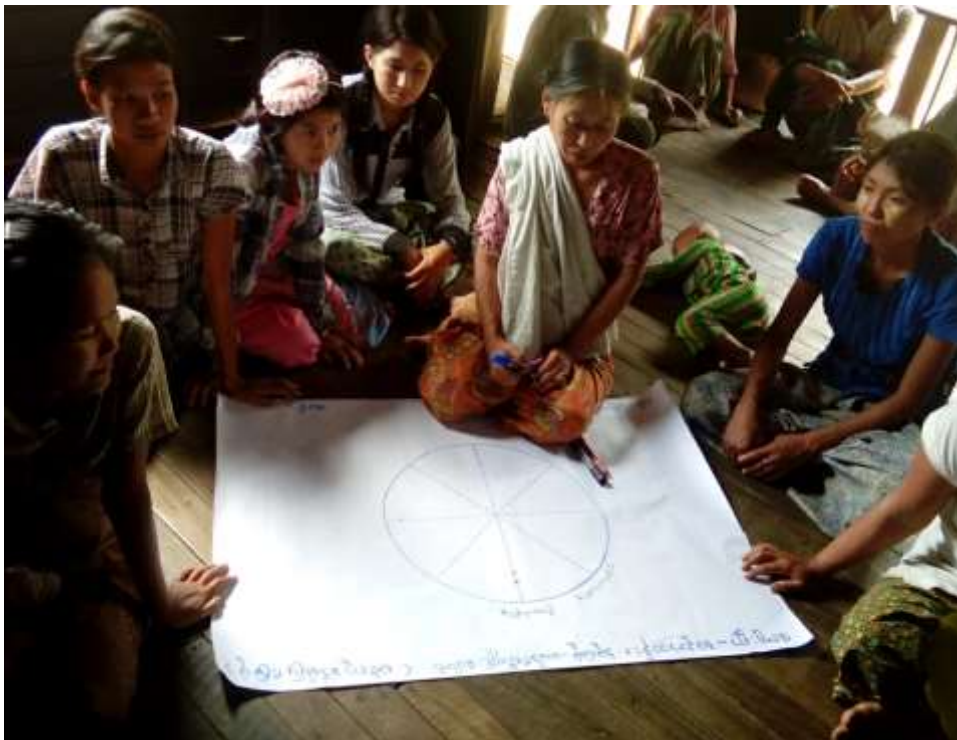
သာပေါင်းမြို့နယ်၊ မယ်ဇလီကွင်းပေါက်အုပ်စု၊ အညာတန်းကျေးရွာတွင် PRA Tools များ ပြုလုပ်ပုံ