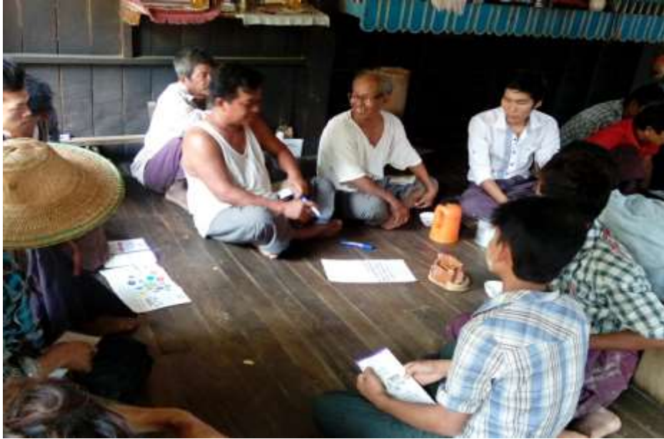
သာပေါင်းမြို့နယ်၊ မယ်ဇလီကွင်းပေါက်အုပ်စု၊ အညာတန်းကျေးရွာတွင် PRA Tools များ ပြုလုပ်ပုံ