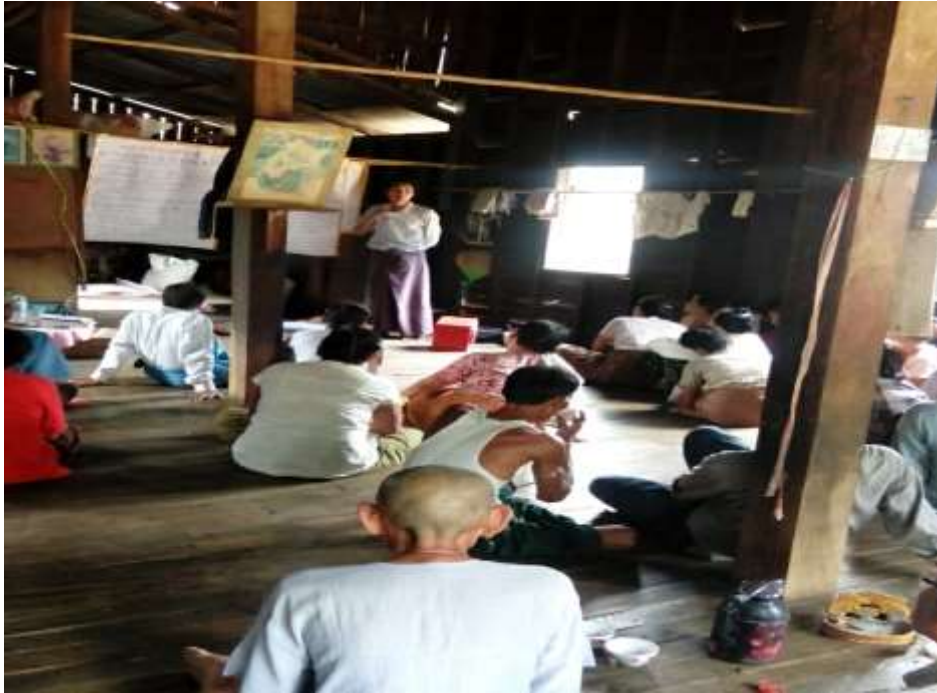
သာပေါင်းမြို့နယ်၊ မယ်ဇလီကွင်းပေါက်အုပ်စု၊ အညာတန်းကျေးရွာ PRA Tools များ ပြုလုပ်ပုံ