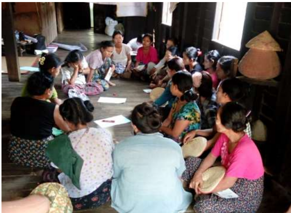
သာပေါင်းမြို့နယ်၊ မယ်ဇလီကွင်းပေါက်အုပ်စု၊ အညာတန်းကျေးရွာတွင် အစည်းအဝေးပြုလုပ်ပုံ