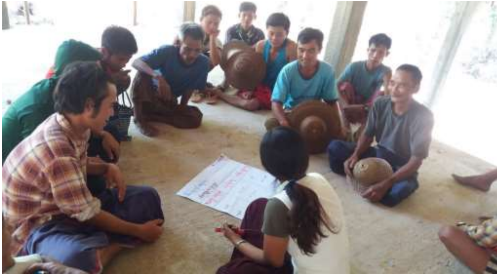
သာပေါင်းမြို့နယ်၊ ရုံးပင်ကျေးရွာအုပ်စု၊ ရိုးဝကျေးရွာတွင် PRA Tools များပြုလုပ်ပုံ