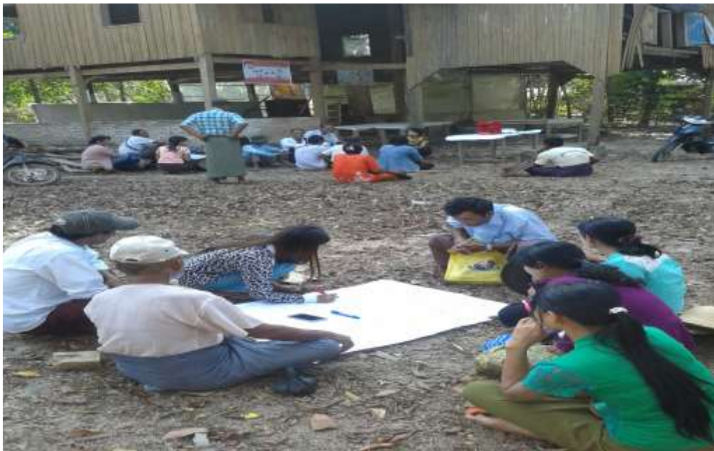
သာပေါင်းမြို့နယ်၊ ရုံးပင်ကျေးရွာအုပ်စု၊ ရိုးဝကျေးရွာအစည်းအဝေးကျင်းပပုံ