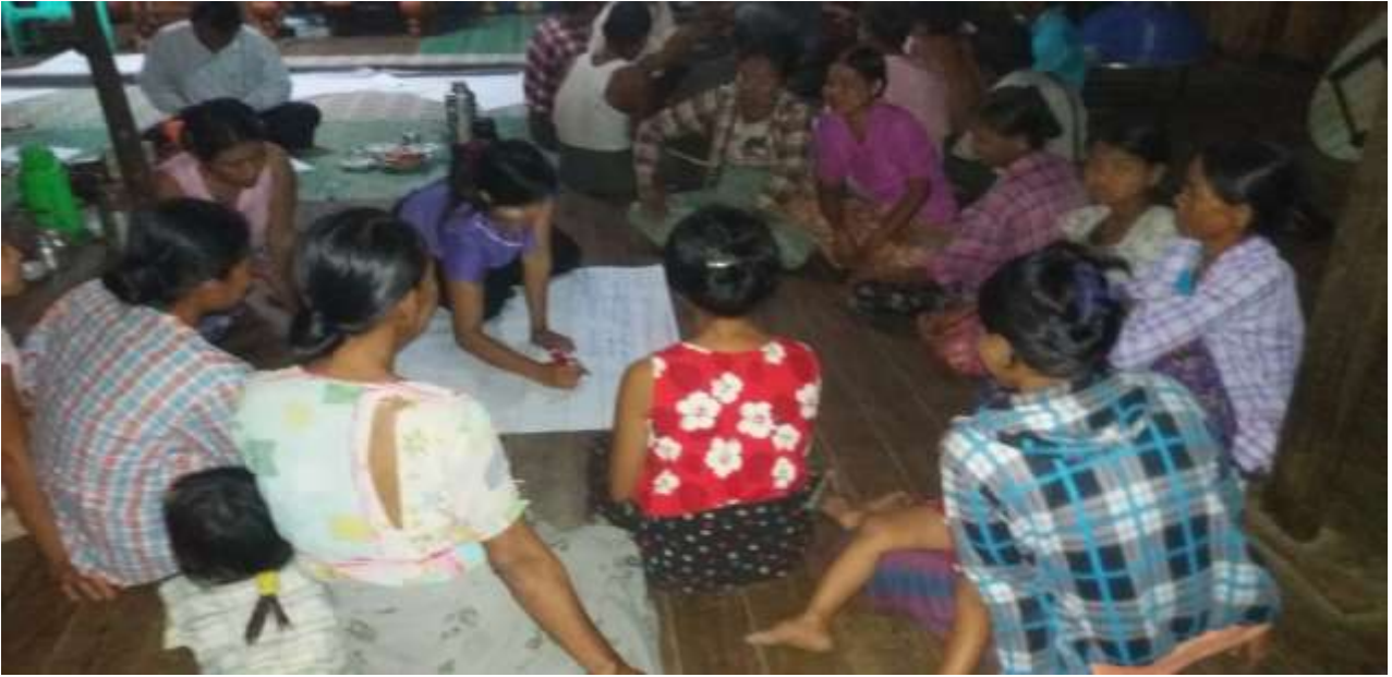
သာပေါင်းမြို့နယ် ရုံးပင်ကျေးရွာအုပ်စု၊ ရွာသစ်ကုန်းကျေးရွာတွင် PRA Tools များပြုလုပ်ပုံ