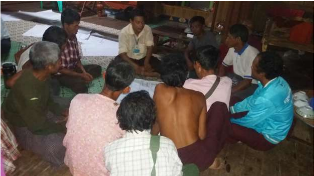
သာပေါင်းမြို့နယ် ၊ ရုံးပင်ကျေးရွာအုပ်စု၊ ရွာသစ်ကုန်းကျေးရွာ PRA Tools များပြုလုပ်ပုံ