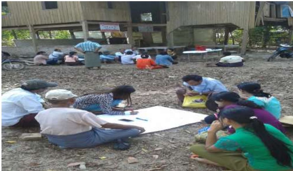
သာပေါင်းမြို့နယ်၊ ရုံးပင်ကျေးရွာစု၊ အုပ်စု အစည်းအဝေး