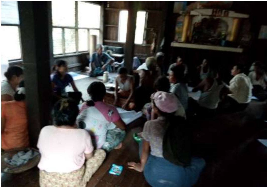
သာပေါင်းမြို့နယ်ရွာရုံးပင်ကျေးရွာအုပ်စု၊ ရုံးပင်ကျေးရွာတွင် PRA Tools များပြုလုပ်ပုံ