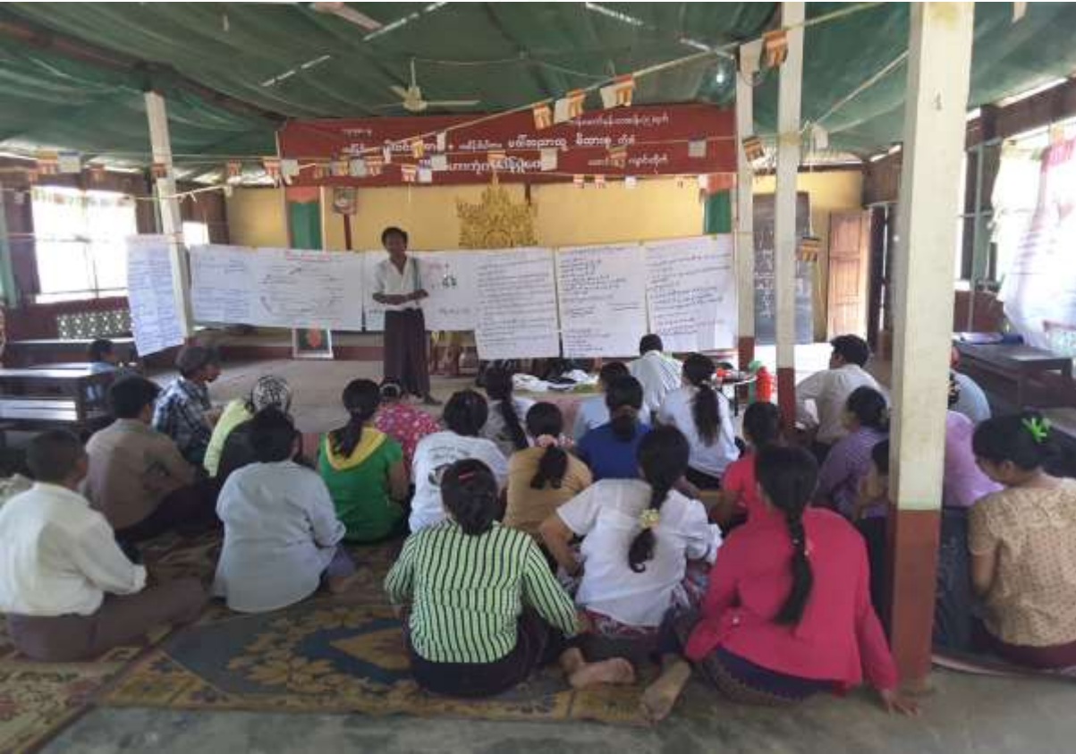
သာပေါင်းမြို့နယ်၊ ငါးဘတ်ချောင်းကျေးရွာအုပ်စု၊ ကြိုးကြာကွင်းကျေးရွာတွင်အစည်းအဝေးကျင်းပပုံ