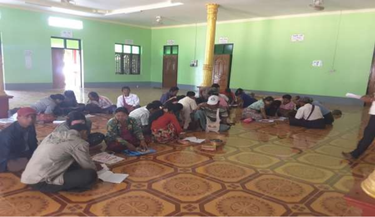
သာပေါင်းမြို့နယ်၊ ငါးဘတ်ချောင်းအုပ်စု၊ ကြိုးကြာကွင်းကျေးရွာအစည်းအဝေးကျင်းပပုံ