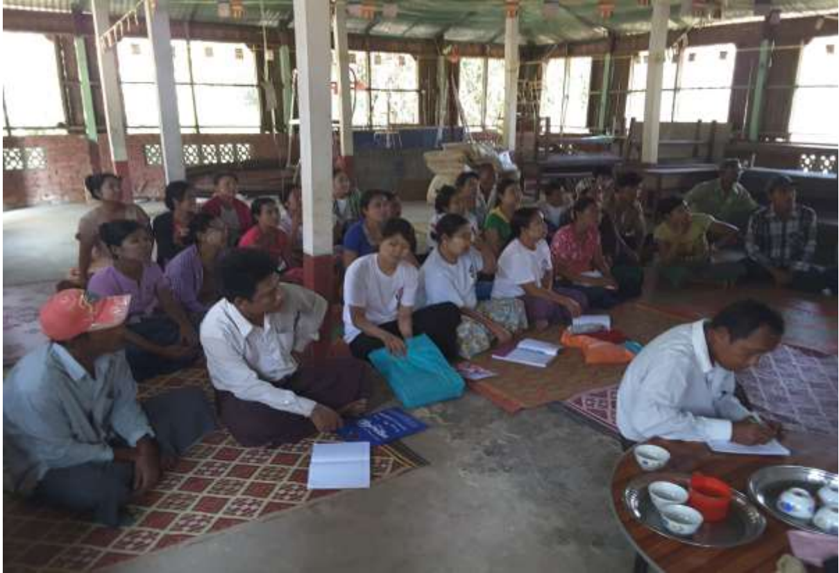
သာပေါင်းမြို့နယ်၊ ငါးဘတ်ချောင်းအုပ်စု၊ ကြိုးကြာကွင်းကျေးရွာတွင်အစည်းအဝေးကျင်းပနေပုံ