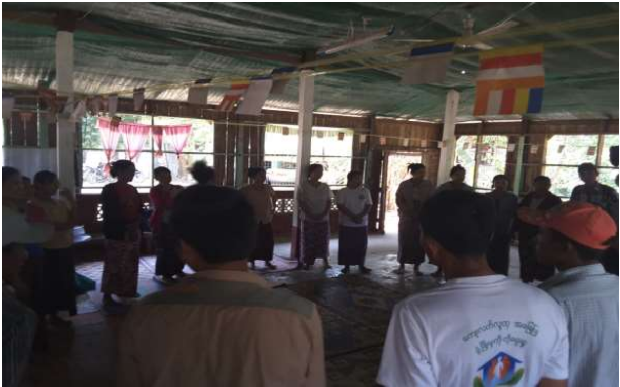
သာပေါင်းမြို့နယ်၊ ငါးဘတ်ချောင်းအုပ်စု၊ ကြိုးကြာကွင်းကျေးရွာအစည်းအဝေးကျင်းပနေပုံ