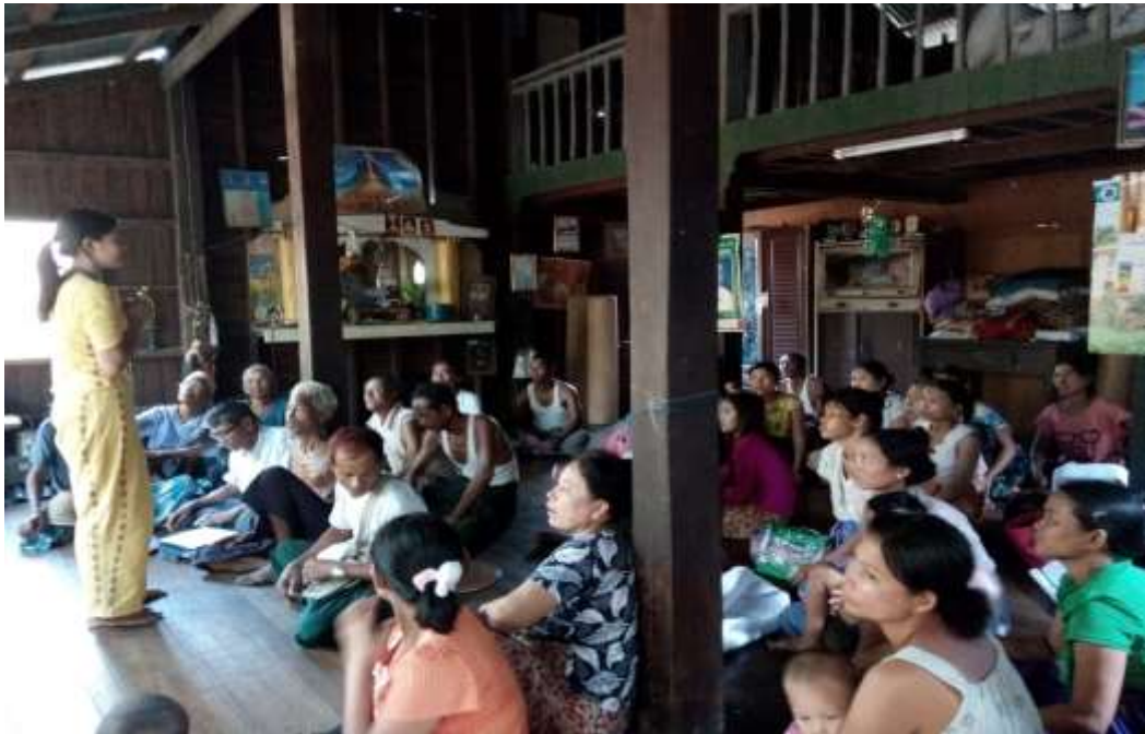
သာပေါင်းမြို့နယ်၊ ငါးဘတ်ချောင်းအုပ်စု၊ နောက်ကျေးရွာတွင် PRA Tools များပြုလုပ်ပုံ