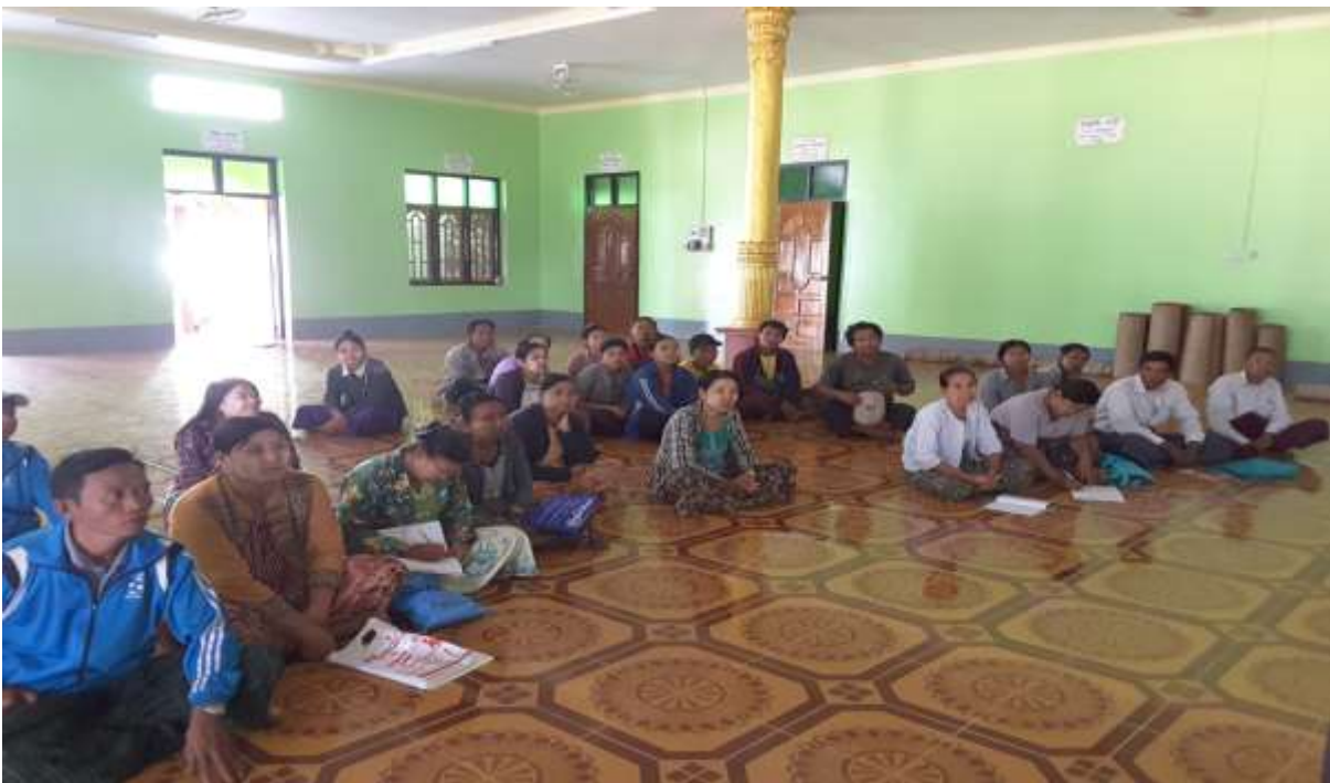
သာပေါင်းမြို့နယ်၊ ငါးဘတ်ချောင်းအုပ်စု၊ လယ်တီကြီးကျေးရွာတွင်အစည်းအဝေးကျင်းပနေပုံ