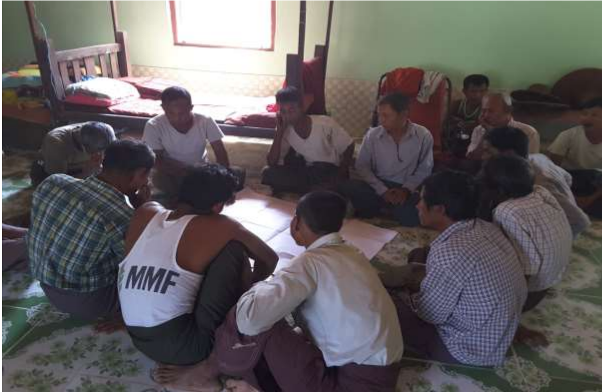
သာပေါင်းမြို့နယ်၊ ငါးဘတ်ချောင်းအုပ်စု၊ လယ်တီကြီးကျေးရွာတွင် PRA Tools များ