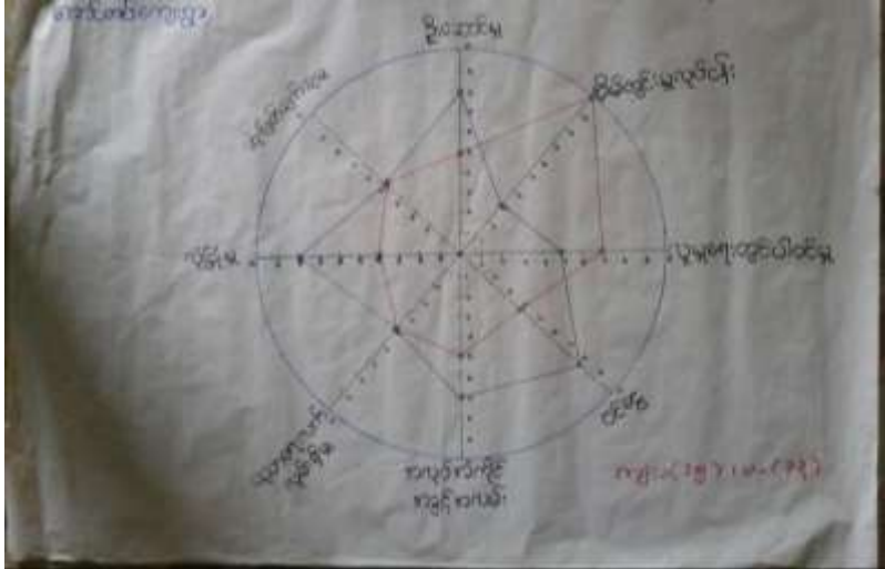
သုံးသပ်ချက်

ကျားမရေးရာကဏ္ဍကိုပင့်ကူအိမ်စနစ်ဖြင့်ပြသပုံကဘုန်းကြီးကျောင်းတွင်(၂၂.၁.၂၀၁၇)ရက်နေ့တွင် ရေးဆွဲဆွေးနွေးရာဝင်ငွေ၊လူမှုရေးလုပ်ငန်းတွင်ပါဝင်နိုင်မှု၊ဆုံးဖြတ်ချက်ချနိုင်မှု၊အလုပ်အကိုင်အခွင့်အလမ်းရရှိမှု၊လုံခြုံမှု၊ဦးဆောင်နိုင်မှု၊ပညာရေးအခွင့်အလမ်း၊အိမ်တွင်းမှုစသည့်အချက်များကိုအခြေခံ၍အမျိုးသားအုပ်စုနှင့်အမျိုးသမီးအုပ်စုခွဲပြီးသုံးသပ်ခဲ့ပါသည်။