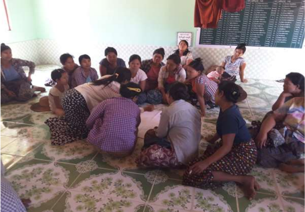
သာပေါင်းမြို့နယ်၊ ငါးဘတ်ချောင်းအုပ်စု၊ လယ်တီကြီးကျေးရွာတွင် PRA Tools များပြုလုပ်ပုံ