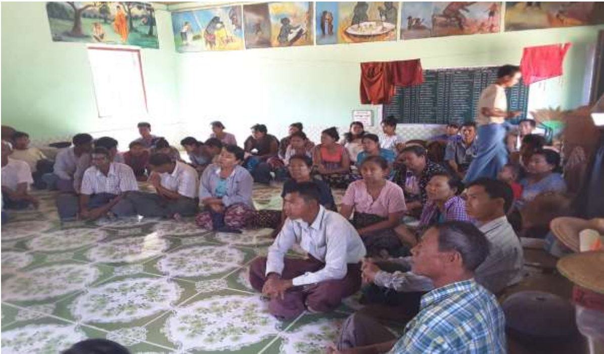
သာပေါင်းမြို့နယ်၊ ငါးဘတ်ချောင်းအုပ်စု၊ လယ်တီကြီးကျေးရွာတွင်အစည်းအဝေးကျင်းပနေပုံ