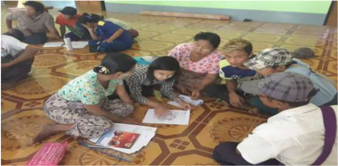
သာပေါင်းမြို့နယ်၊ ငါးဘတ်ချောင်းကျေးရွာအုပ်စု၊ ရုံးပင်လေးကျေးရွာတွင် PRA Tools များပြုလုပ်ပုံ