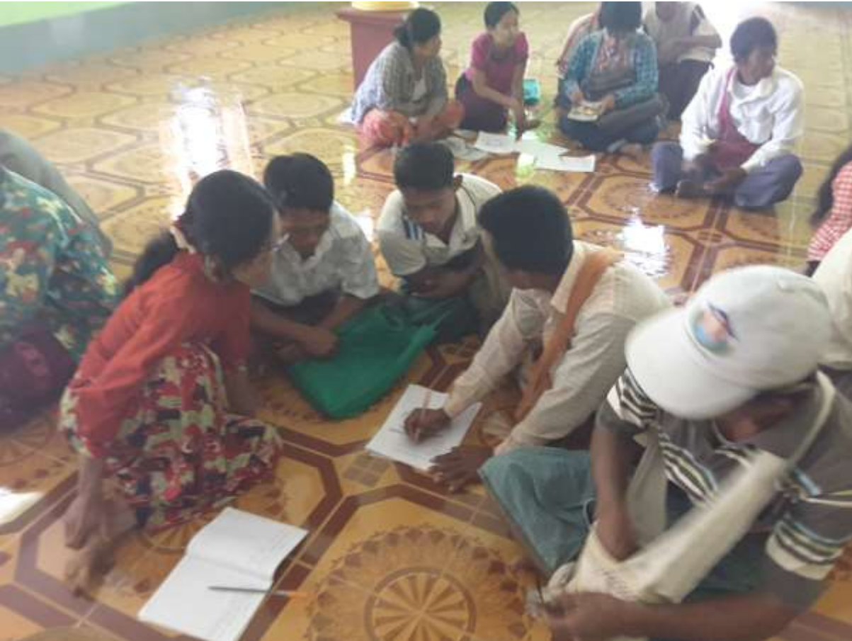
သာပေါင်းမြို့နယ်၊ ရုံးပင်လေးကျေးရွာတွင်ကျေးရွာအစည်းအဝေးကျင်းပနေပုံ ]