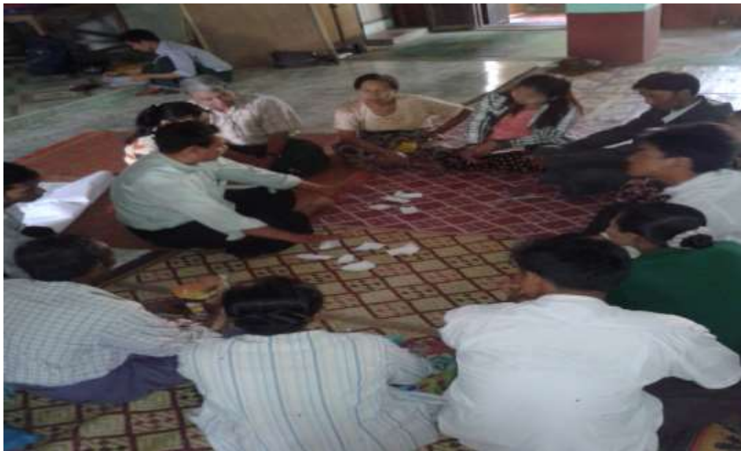
သာပေါင်းမြို့နယ်၊ ရုံးပင်လေးကျေးရွာတွင် အုပ်စုအစည်းအဝေးကျင်းပပုံ