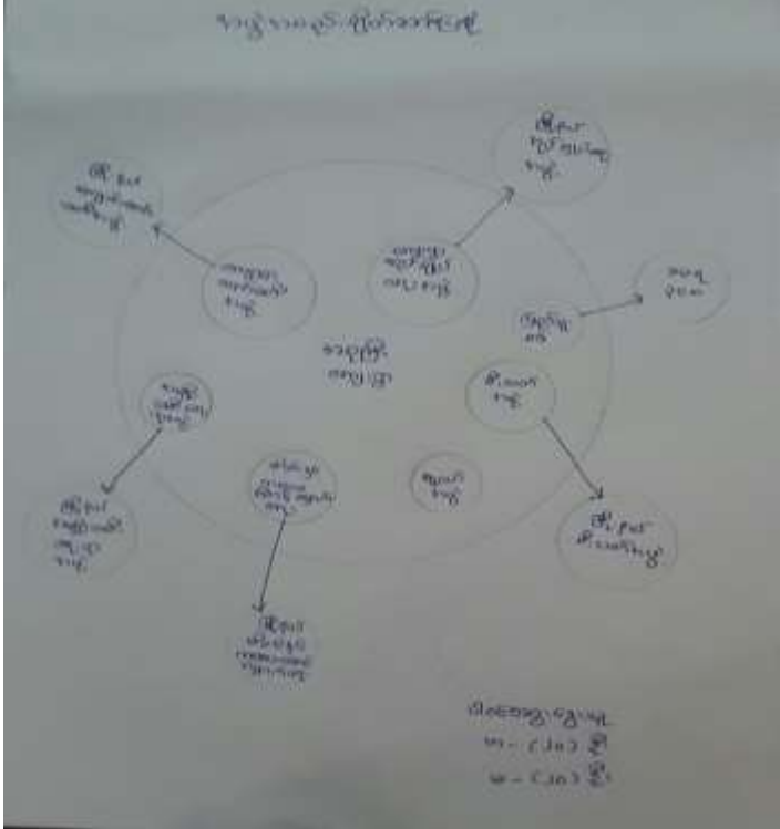
သုံးသပ်ချက်

အဖွဲ့အစည်းချိတ်ဆက်ပြဇယားကိုအစုကြီး၊ တင်းကုတ်ကြီးဘုန်းကြီးကျောင်းတွင်(၂၄.၁.၂၀၁၇) ရက်နေ့တွင်ရေးဆွဲဆွေးနွေးရာကျေးရွာအတွင်းအုပ်ချုပ်ရေးနှင့်ပတ်သက်၍ရာအိမ်မှူး၊ကျေးရွာအုပ်ချုပ်ရေး မှူးနှင့်မြို့နယ်အုပ်ချုပ်ရေးမှူး၊မြို့နယ်ရဲစခန်းတို့နှင့်ချိတ်ဆက်ဆောင်ရွက်ပါသည်။