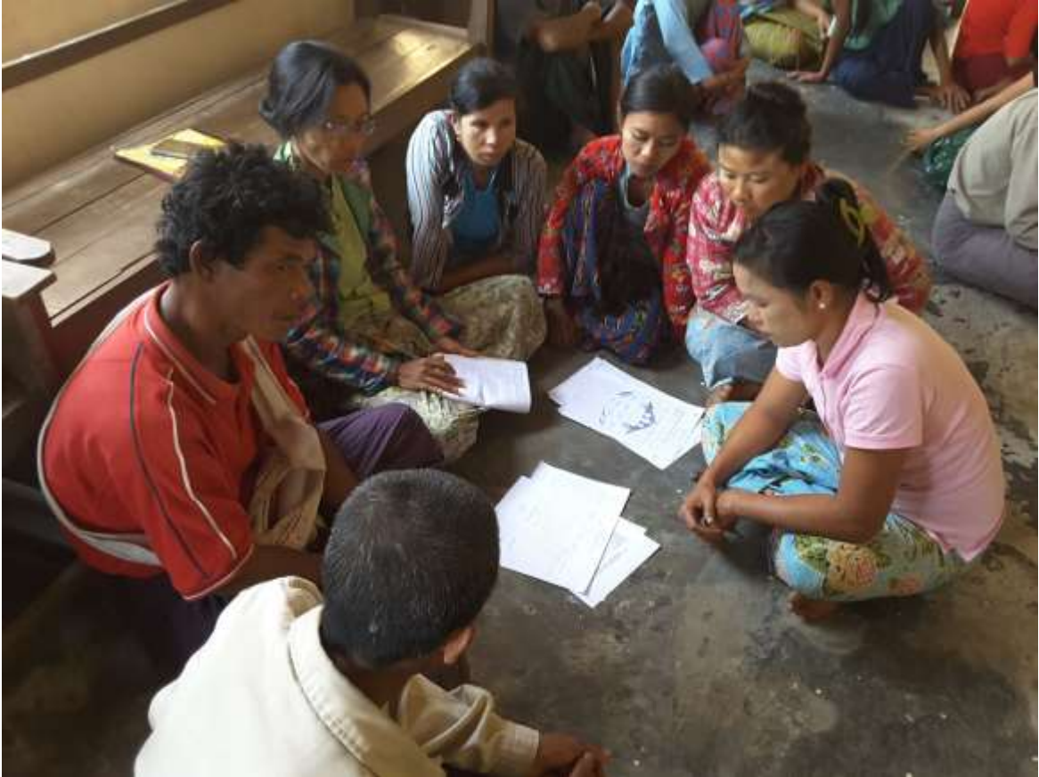
သာပေါင်းမြို့နယ်၊ ရုံးပင်လေးကျေးရွာတွင် PRA Tools များပြုလုပ်ပုံ