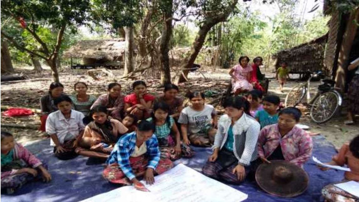
သာပေါင်းမြို့နယ်၊ မရမ်းကုန်းကျေးရွာတွင်အစည်းအဝေးကျင်းပနေပုံ