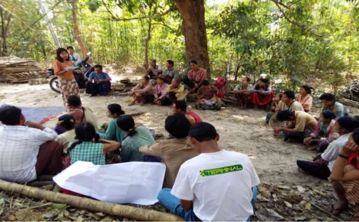
သာပေါင်းမြို့နယ်၊ ငါးဘတ်ချောင်းအုပ်စု၊ မရမ်းကုန်းကျေးရွာတွင် PRA Tools များပြုလုပ်ပုံ