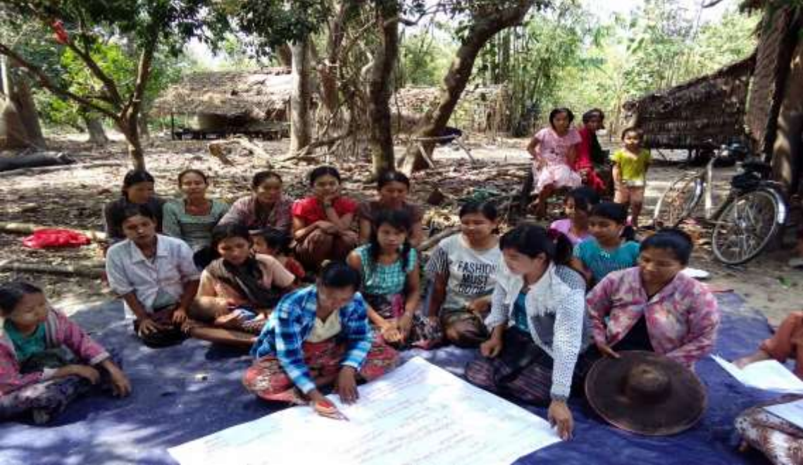
သာပေါင်းမြို့နယ်၊ မရမ်းကုန်းကျေးရွာတွင် PRA Tools အစည်းအဝေးကျင်းပပုံ