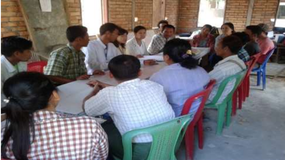
သာပေါင်းမြို့

နယ်၊ ငါးဘတ်ချောင်းအုပ်စု၊ ဆင်ကုန်းကျေးရွာအုပ်စုအစည်းအဝေး