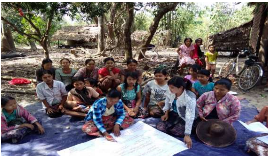
သာပေါင်းမြို့နယ်၊ ကွင်းပေါက်ကျေးရွာတွင်အုပ်စုအစည်းအဝေးကျင်းပပုံ