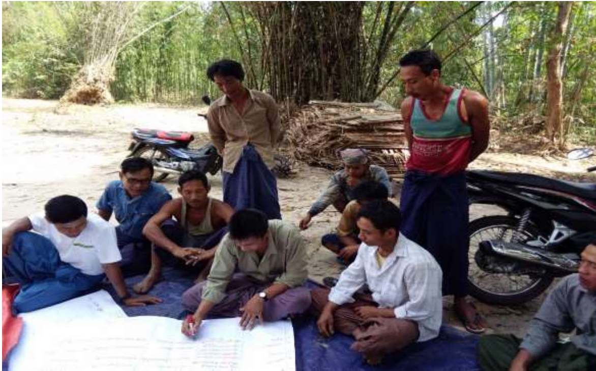
သာပေါင်းမြို့နယ်၊ ကွင်းပေါက်ကျေးရွာတွင် PRA Tools များပြုလုပ်ပုံ