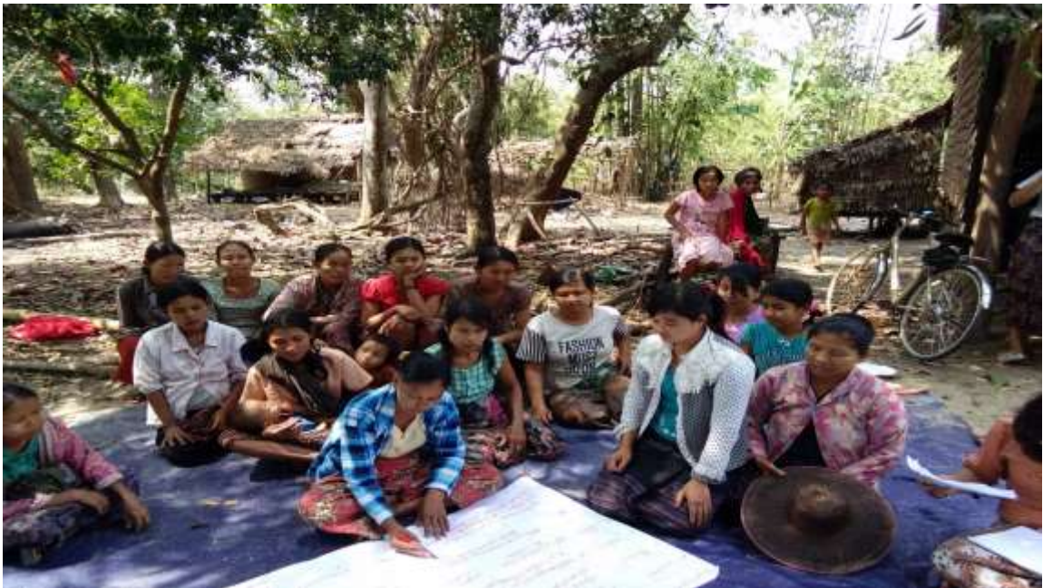
သာပေါင်းမြို့နယ်၊ ကွင်းပေါက်ကျေးရွာတွင်အစည်းအဝေးကျင်းပနေပုံ