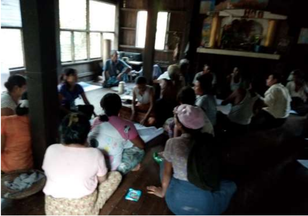
သာပေါင်းမြို့နယ်ရွာ၊ ခွေးကုတ်ကျေးရွာအုပ်စု၊ မောင်နှမကုန်းကျေးရွာတွင် PRA Tools များပြုလုပ်ပုံ