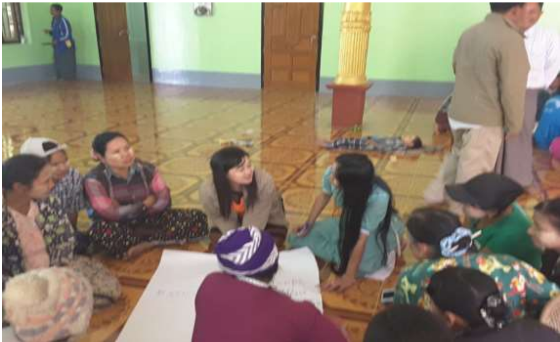
သာပေါင်းမြို့နယ်၊ ဝါးဘတ်ချောင်းအုပ်စု၊ ဆင်ကုန်းကျေးရွာအုပ်စုအစည်းအဝေး