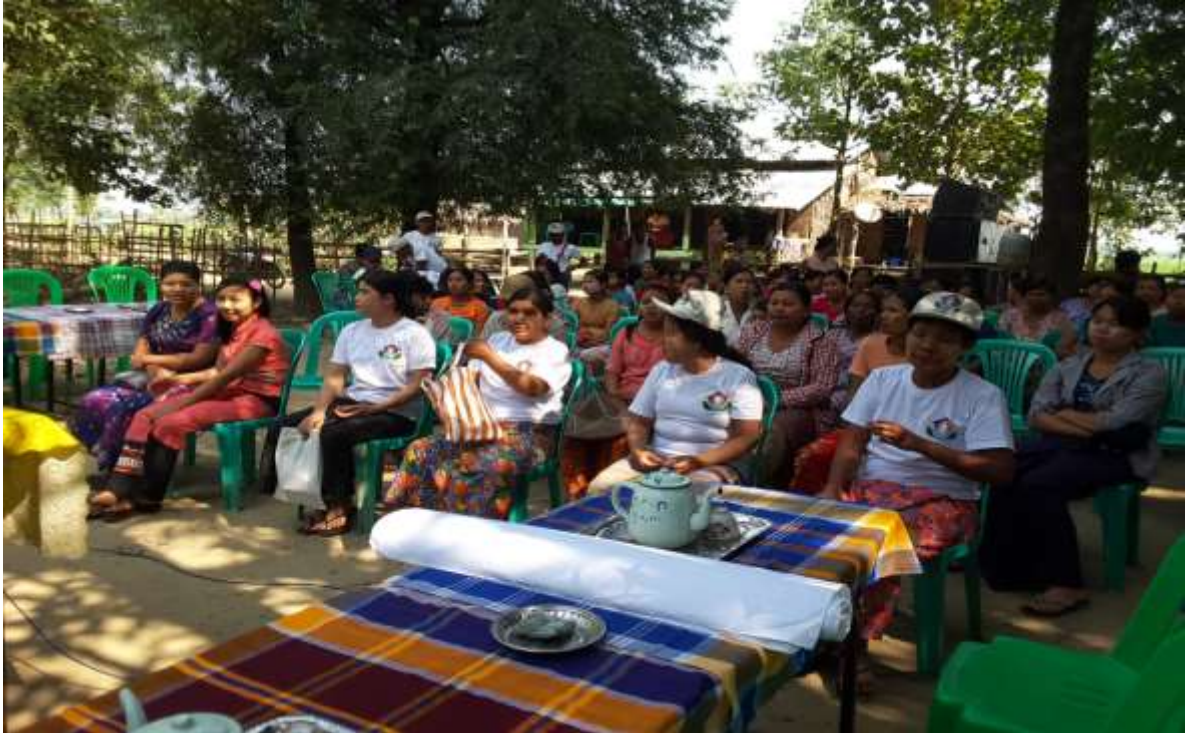
သာပေါင်းမြို့နယ်၊ ရွေးကုတ်အုပ်စု၊ အနန်းကုန်းကျေးရွာ အစည်းအဝေးကျင်းပပုံ