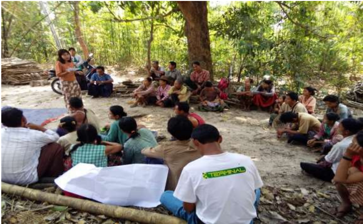
သာပေါင်းမြို့နယ်၊ခွေးကုတ်အုပ်စု၊ ထန်းပင်ကုန်းကျေးရွာတွင် PRA Tools များပြုလုပ်ပုံ