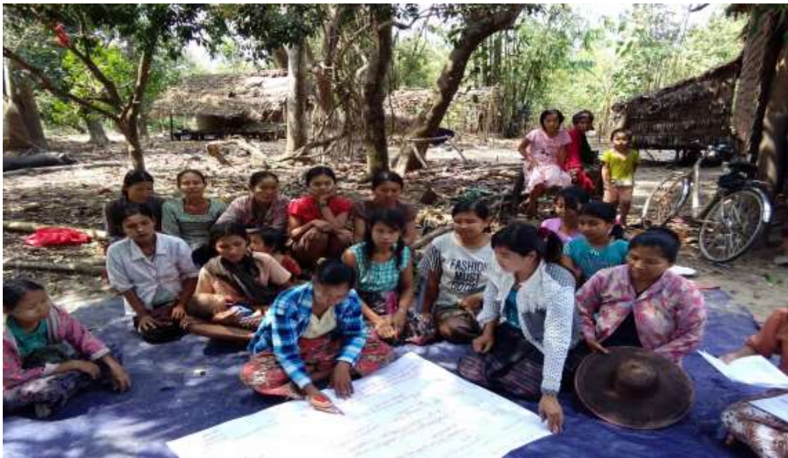
သာပေါင်းမြို့နယ်၊ ထန်းပင်ကုန်းကျေးရွာတွင်PRA Tools အစည်းအဝေးကျင်းပပုံ