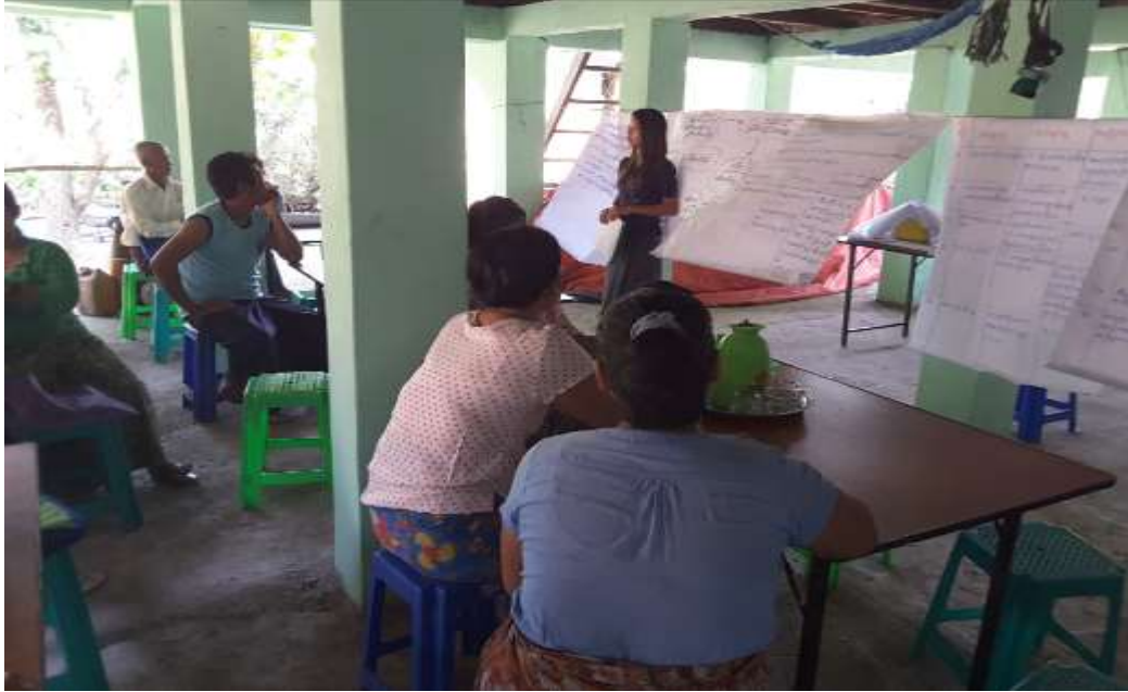
သာပေါင်းမြို့နယ်၊ နွယ်နီချောင်းကျေးရွာအုပ်စု၊ နွယ်နီချောင်းကျေးရွာ ကျေးရွာအစည်းအဝေးပွဲများ၏ မှတ်တမ်းဓာတ်ပုံများ