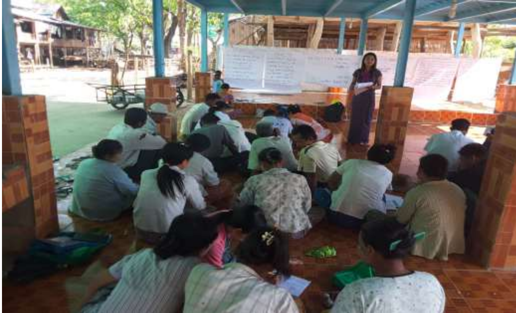
သာပေါင်းမြို့နယ်၊ နွယ်နီချောင်းကျေးရွာအုပ်စု၊ နွယ်နီချောင်းကျေးရွာ ကျေးရွာအစည်းအဝေးပွဲများ၏ မှတ်တမ်းဓာတ်ပုံများ

သာပေါင်းမြို့နယ်၊ နွယ်နီချောင်းကျေးရွာအုပ်စု၊ နွယ်နီချောင်းကျေးရွာ PRA Tools များ ပြုလုပ်ပုံ