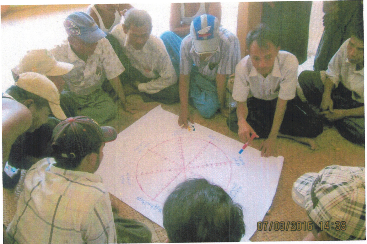
ပြဿနာသစ်ပင်ရေးဆွဲနေသော အမျိုးသမီးအဖွဲ့များ၏ မှတ်တမ်းဓာတ်ပုံ