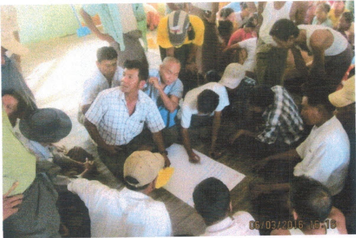
အမျိုးသမီးအဖွဲ့မှ လုပ်ငန်းခွဲများအား စုပေါင်း၍ ရေးဆွဲဆွေးနွေးနေပုံ