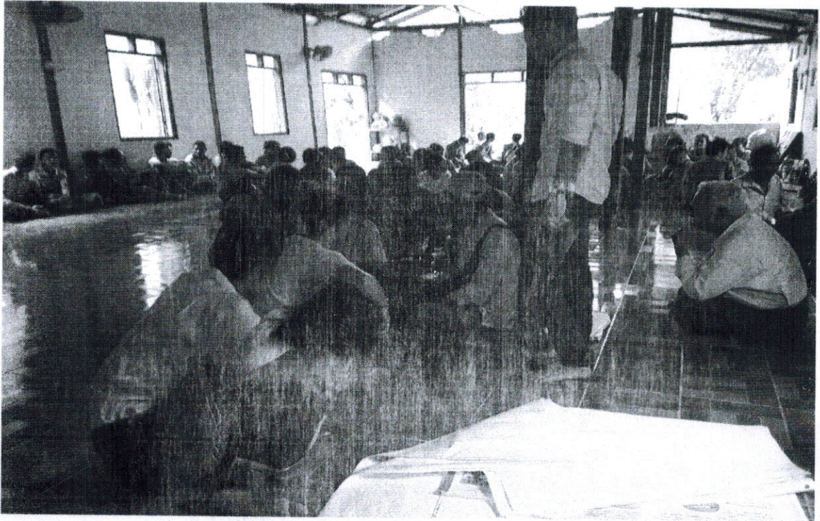
ကျေးရွာဖွံ့ဖြိုးရေးအစီအစဉ်ဆောင်ရွက်မှုမှတ်တမ်းဓာတ်ပုံများ