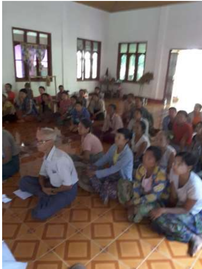
သာပေါင်းမြို့နယ်၊ သရက်ကုန်းကျေးရွာအုပ်စု၊ ရွှေရင်မျှော်ကျေးရွာတွင် အစည်းအဝေးပြုလုပ်ပ