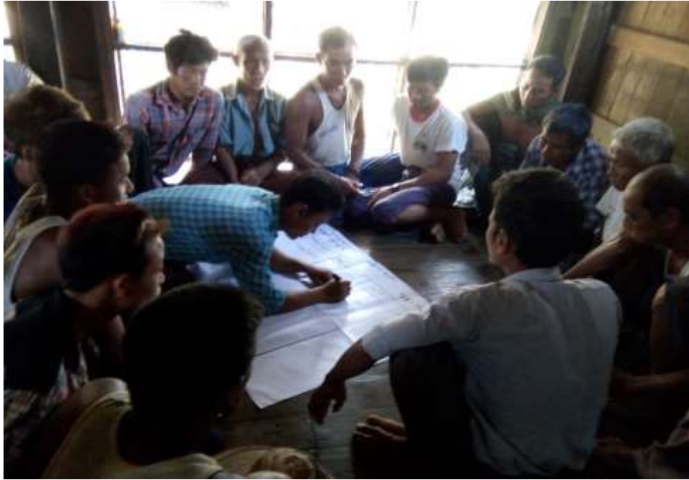
သာပေါင်းမြို့နယ်၊ သရက်ကုန်းအုပ်စု၊ ဆိပ်ကြီးကျေးရွာ PRA Tools များ ပြုလုပ်ပုံ