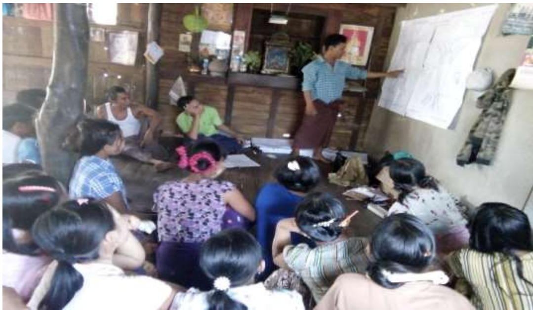
သာပေါင်းမြို့နယ်၊ သရက်ကုန်းအုပ်စု၊ ဆိပ်ကြီးကျေးရွာတွင် အစည်းအဝေးပြုလုပ်ပုံ