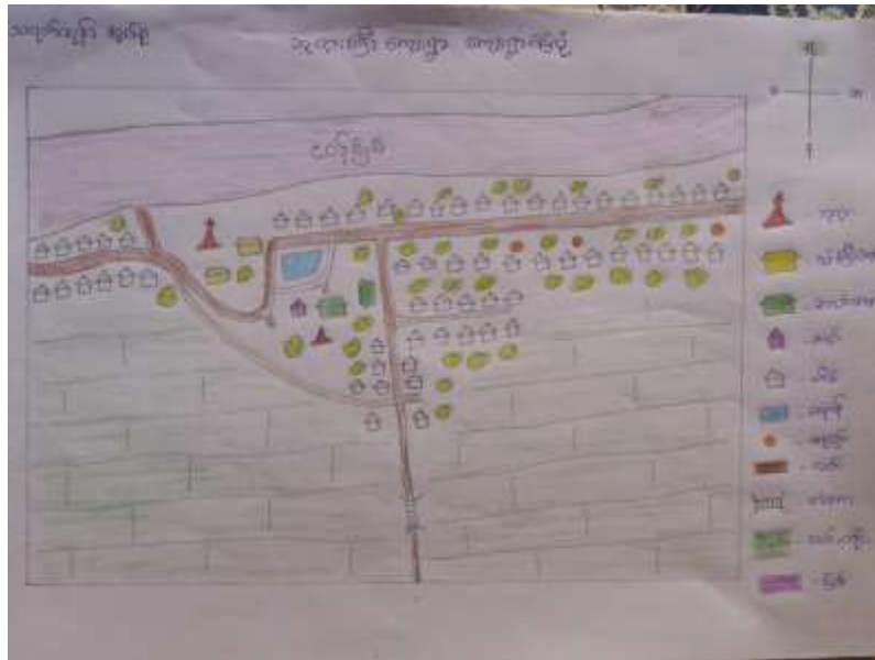
သုံးသပ်ချက်