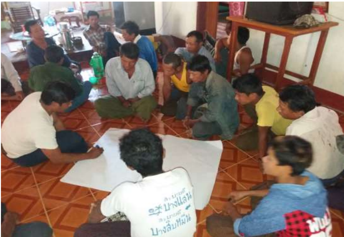
သာပေါင်းမြို့နယ်၊ သရက်ကုန်းကျေးရွာအုပ်စု၊ ဘုရားကြီးကျေးရွာတွင် အစည်းအဝေးပြုလုပ်ပုံ