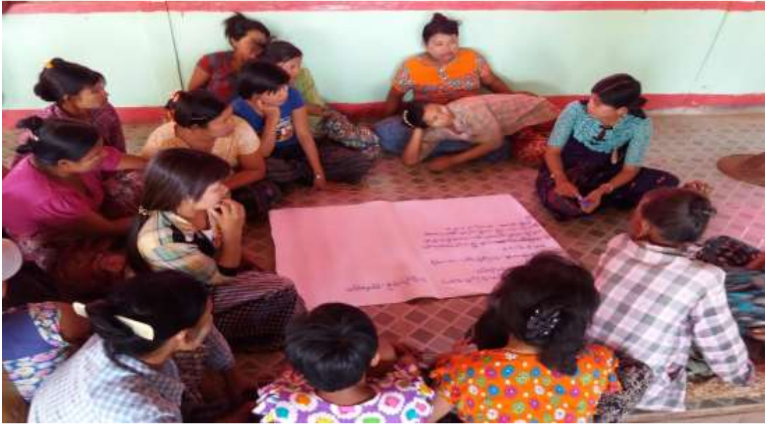
သာပေါင်းမြို့နယ်၊ သရက်ကုန်းကျေးရွာအုပ်စု၊ ဘုရားကြီးကျေးရွာတွင် PRA Tools များ ပြုလုပ်ပုံ