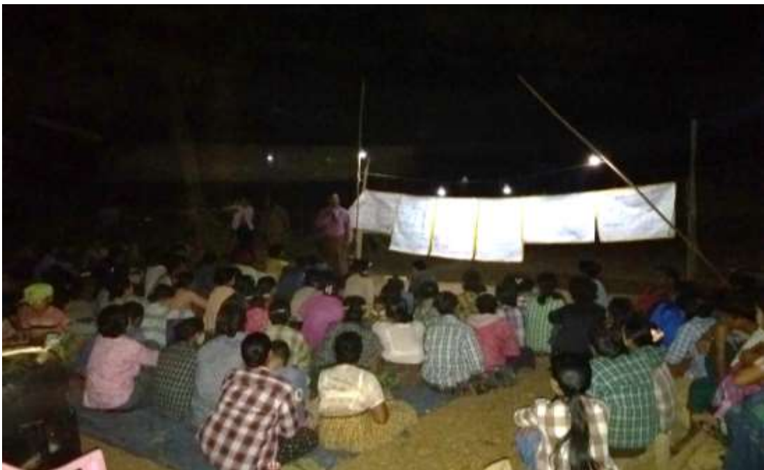
သာပေါင်းမြို့နယ်၊ သရက်ကုန်းအုပ်စု၊ ပေါက်လွှတ်ကျေးရွာတွင်အစည်းအဝေးပြုလုပ်ပုံ