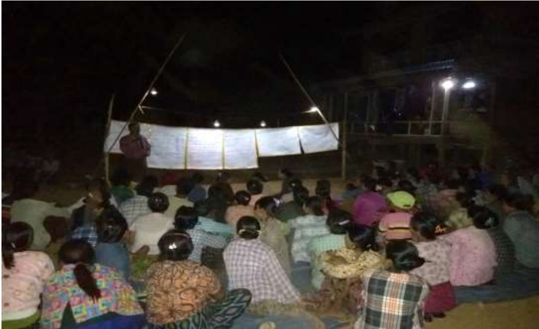
သာပေါင်းမြို့နယ်၊ သရက်ကုန်းကျေးရွာအုပ်စု၊ ပေါက်လွှတ်ကျေးရွာတွင် PRA Tools များ ပြုလုပ်ပုံ