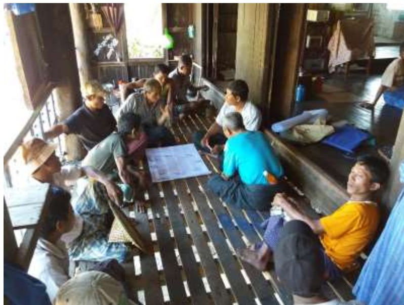
သာပေါင်းမြို့နယ်၊ သရက်ကုန်းကျေးရွာအုပ်စု၊ အလယ်စုကျေးရွာ အစည်းအဝေးပြုလုပ်ပုံ