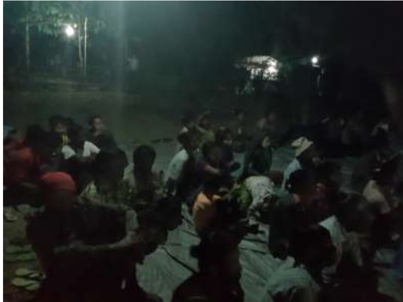
သာပေါင်းမြို့နယ်၊ သရက်ကုန်းကျေးရွာအုပ်စု၊ အလယ်စုကျေးရွာ PRA Tools များ ပြုလုပ်ပုံ