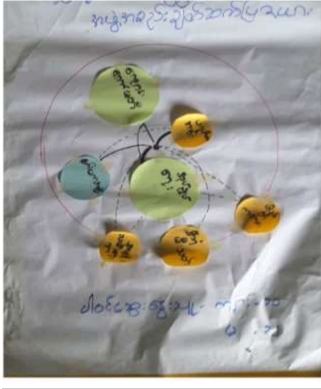
သုံးသပ်ချက်

အဖွဲ့အစည်းချိတ်ဆက်ပြဇယားကို သရက်ကုန်းကျေးရွာ၊ ရပ်မိရပ်ဖအိမ်တွင် (၂၃.၂.၂၀၁၆)ရက်နေ့တွင် ရေးဆွဲကြပါသည်။ အဖွဲ့အစည်း ချိတ်ဆက်ပြဇယားကို ကျေးရွာလူထုနှင့်ရေးဆွဲရာတွင် ကျေးရွာအတွင်းအုပ်ချုပ်ရေးသည် မြို့နယ်အုပ်ချုပ်ရေးနှင့် ချိတ်ဆက်ဆောင်ရွက်ပါသည်။ အမျိုးသမီးရေးရာအဖွဲ့သည် မြို့နယ်အမျိုးသမီးရေးရာနှင့် ချိတ်ဆက်ဆောင်ရွက်ပါသည်။ ကျောင်းကော်မတီသည် မြို့နယ်ပညာရေးနှင့် ချိတ်ဆက်ဆောင်ရွက်ပါသည်။ မိခင်နှင့်ကလေး စောင့်ရှောက်ရေးအဖွဲ့သည် မြို့နယ် မိခင်နှင့်ကလေးစောင့်ရှောက်ရေးအဖွဲ့နှင့် ချိတ်ဆက်ဆောင်ရွက်ပါသည်။ ကျန်းမာရေးဌာနသည် တိုက်နယ်ဆေးရုံနှင့်ချိတ်ဆက် ဆောင်ရွက်ပါသည်။ မီးသတ်အဖွဲ့သည် မြို့နယ်မီးသတ်နှင့် ချိတ်ဆက်ဆောင်ရွက်ပါသည်။