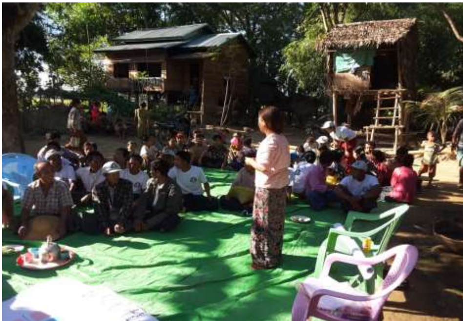
သာပေါင်းမြို့နယ်၊ ဆင်လမ်းကျေးရွာအုပ်စု၊ ခွေးသေကုန်းကျေးရွာတွင် PRA Tools များ ပြုလုပ်ပုံ