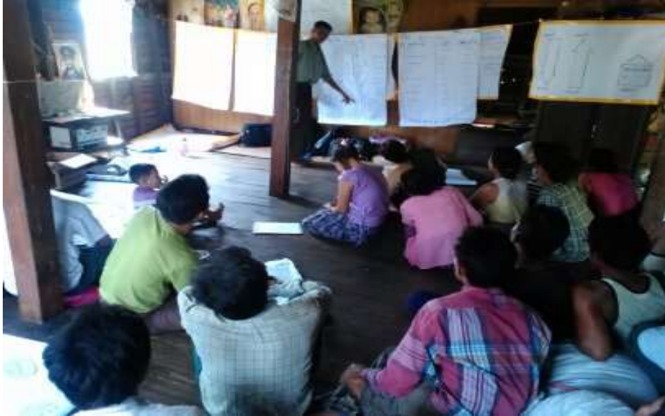
သာပေါင်းမြို့နယ်၊ ဆင်လမ်းကျေးရွာအုပ်စု၊ ခွေးသေကုန်းကျေးရွာတွင် PRA Tools များ ပြုလုပ်ပုံ