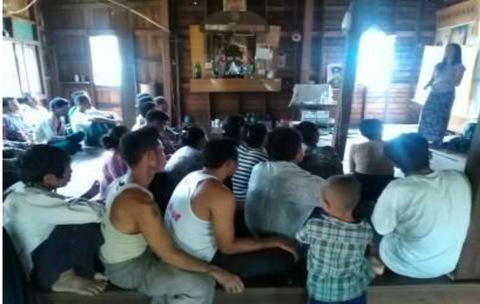
သာပေါင်းမြို့နယ်၊ ဆင်လမ်းကျေးရွာအုပ်စု၊ ခွေးသေကုန်းကျေးရွာတွင် PRA Tools များ ပြုလုပ်ပုံ