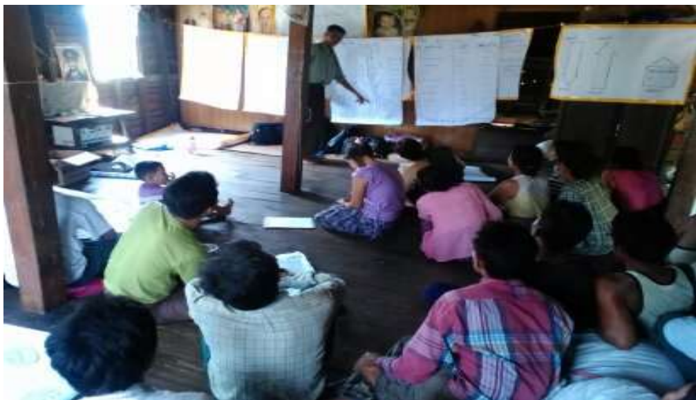
သာပေါင်းမြို့နယ်၊ ဆင်လမ်းကျေးရွာအုပ်စု၊ ခွေးသေကုန်းကျေးရွာ