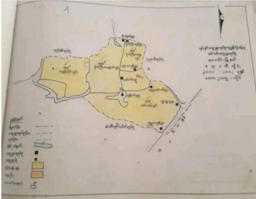
ကျေးရွာအုပ်စုတွင် ပါဝင်သော ကျေးရွာများစာရင်း