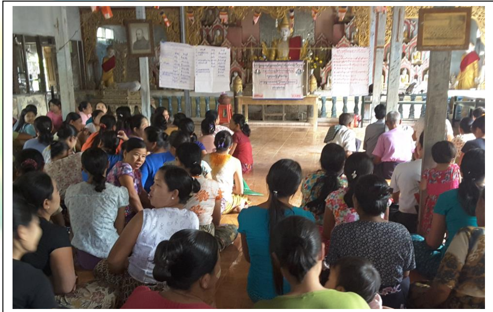
လူထုဗဟိုပြုစီမံကိန်းလုပ်ငန်းအကောင်အထည်ဖော်မှုအစီအစဉ် (ကွမ်ရိုက်ကျေးရွာအုပ်စု၊ ကွမ်ရိုက်ကျေးရွာ)