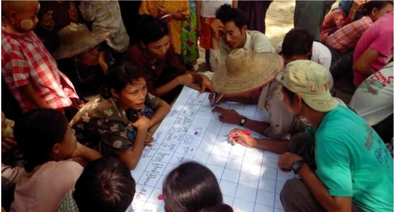
သာပေါင်းမြို့နယ်၊ ကံယားကုန်း ကျေးရွာတွင် အစည်းအဝေးပြုလုပ်ပုံ