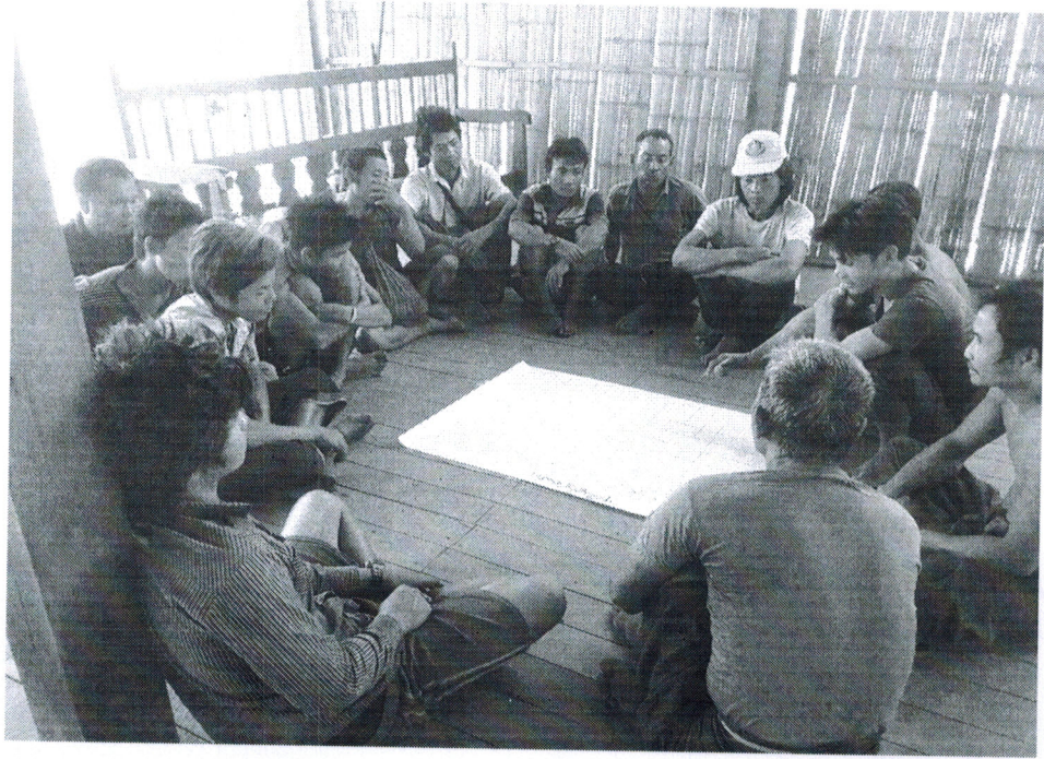
ကျေးရွာဖွံ့ဖြိုးရေးအစီအစဉ်ဆောင်ရွက်မှုမှတ်တမ်းဓါတ်ပုံများ