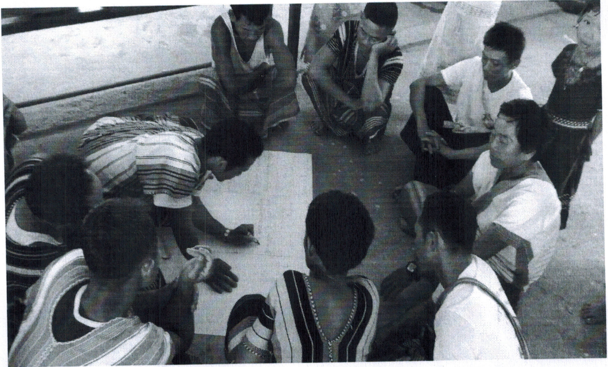
ကျေးရွာဖွံ့ဖြိုးရေးအစီအစဉ်ဆောင်ရွက်မှုမှတ်တမ်းဓာတ်ပုံများ