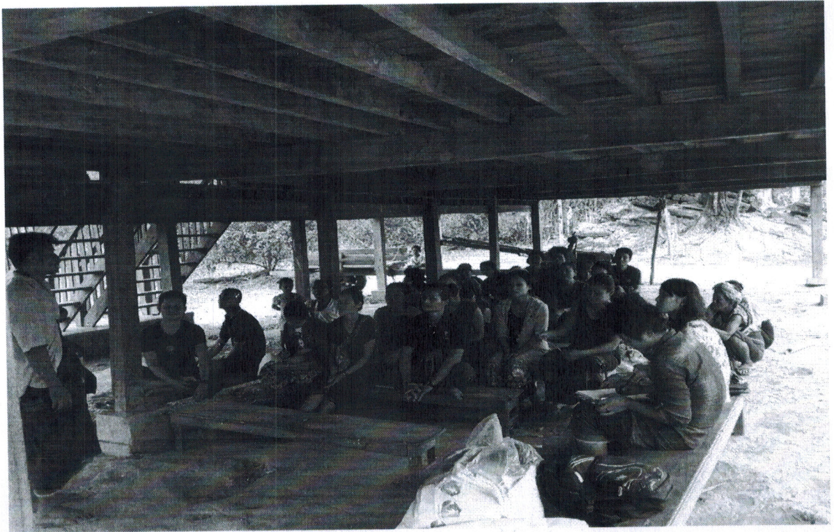
ကျေးရွာဖွံ့ဖြိုးရေးအစီအစဉ်ဆောင်ရွက်မှုမှတ်တမ်းဓါတ်ပုံများ