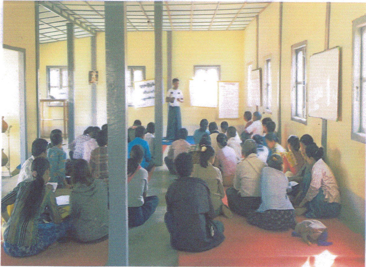
ကျေးရွာအဆင့်စီမံခန့်ခွဲမှုသင်တန်းဆောင်ရွက်နေပုံ