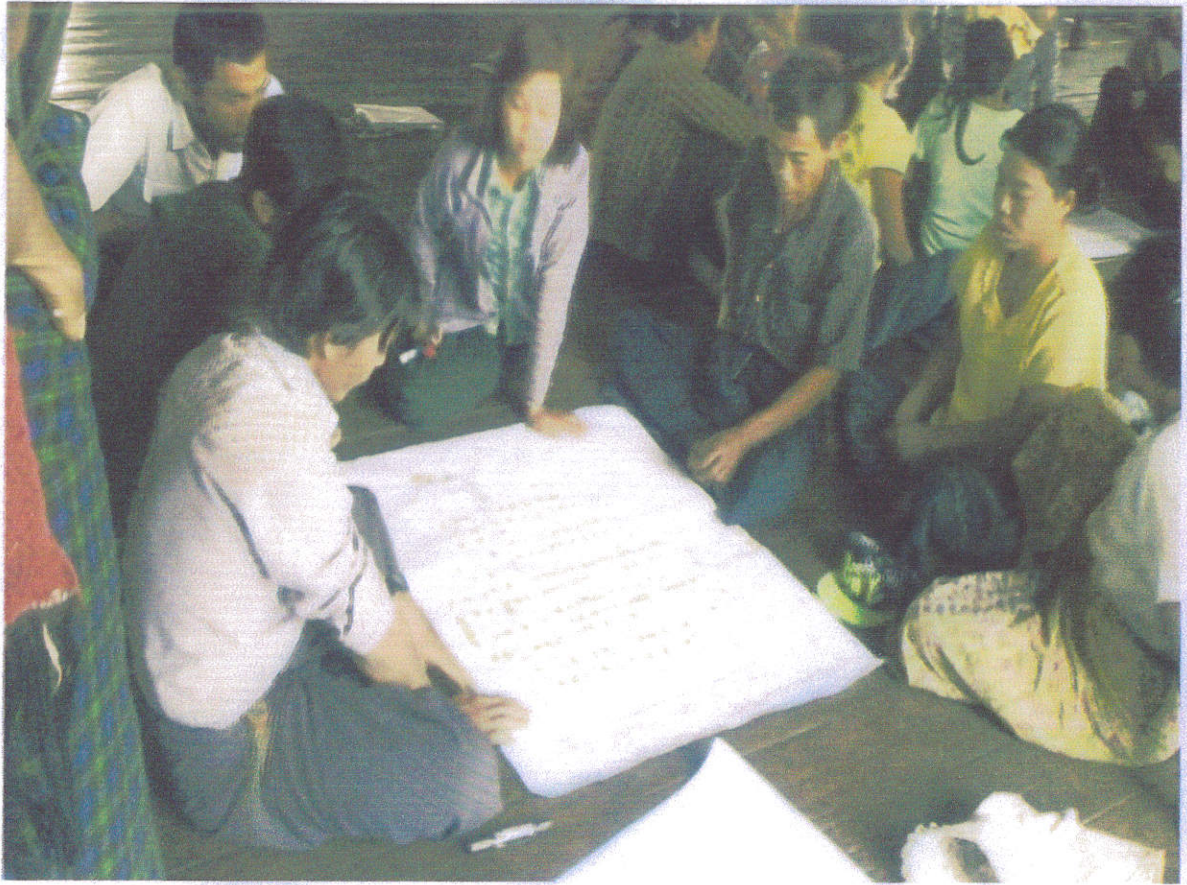
လူမှုရေးအရင်းအမြစ်ပြုပြင်ဆောင်ရွက်ရေးဆွဲနေပုံ