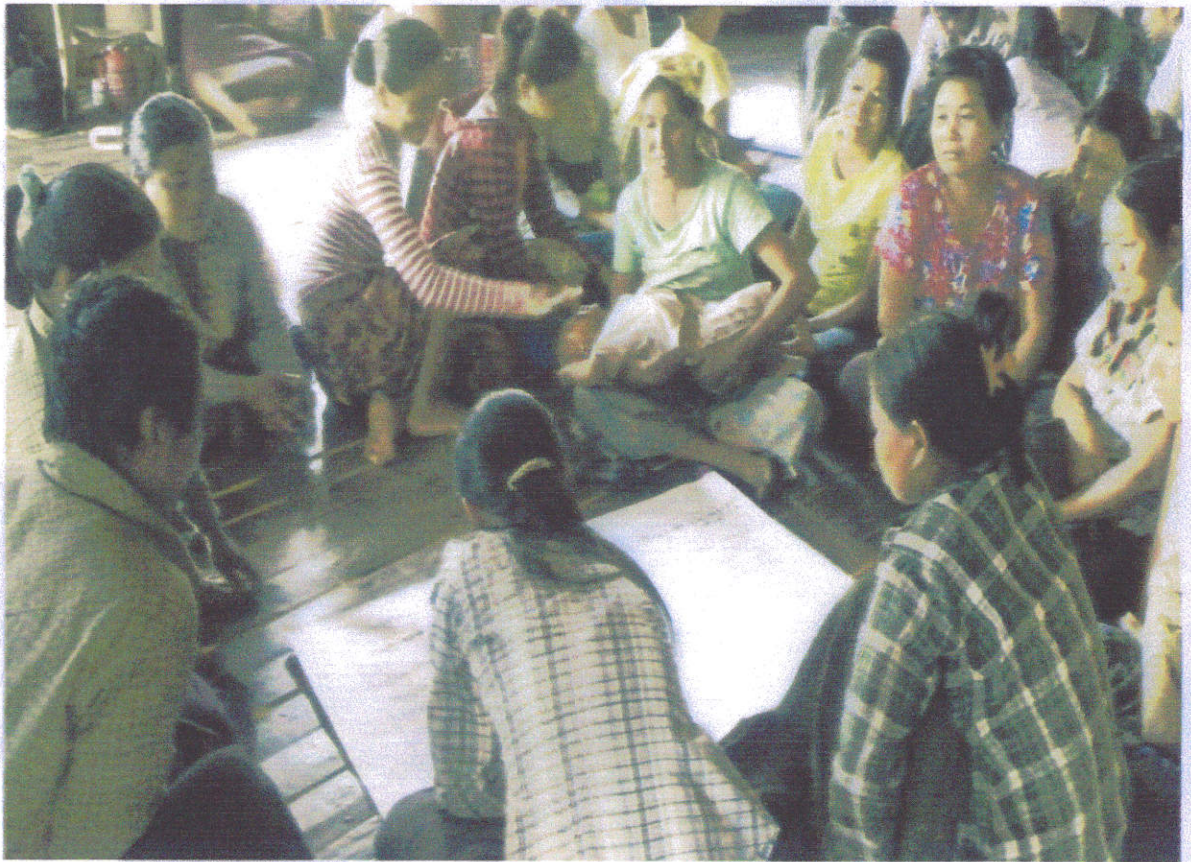
အမျိုးသမီးများအခက်အခဲနှင့်ပြဿနာရှောင်မှန်းချက်များဆွေးနွေးနေပုံ