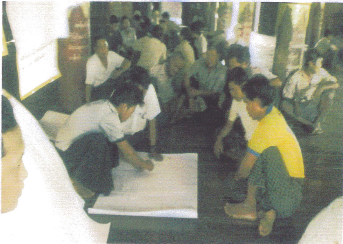
ကျေးရွာကော်မတီရွေးချယ်ခြင်းမဲများရေတွက်နေပုံ