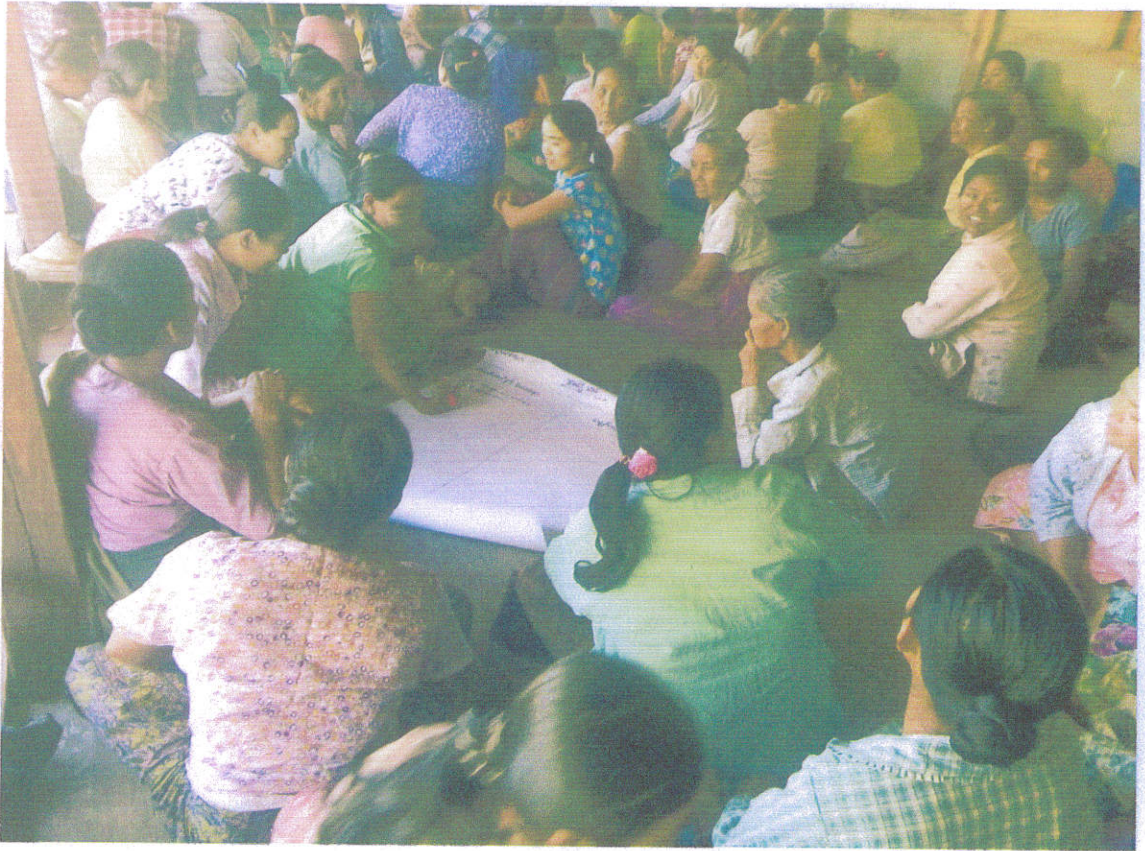
အမျိုးသမီးများ၏အခက်အခဲပြဿနာနှင့်မျှော်မှန်းချက်အားပိုင်းဖွဲ့ဆွေးနွေးပုံ