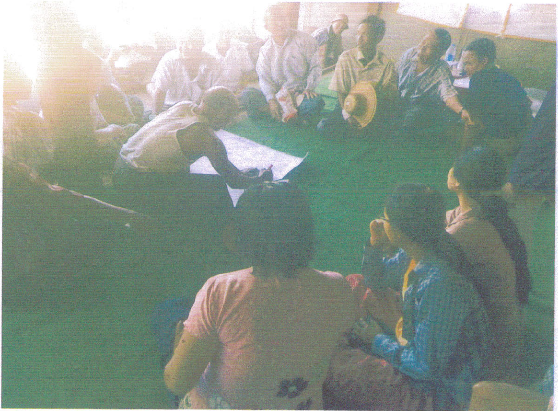
ရာသီခွင်ပြပြကွဲဒိန်အားလွှဲပြောင်းနေပုံ