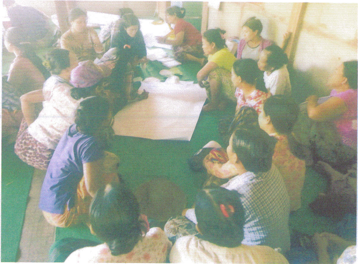
အဖွဲ့အစည်းချိတ်ဆက်မှုများအားဆွေးနွေးနေပုံ