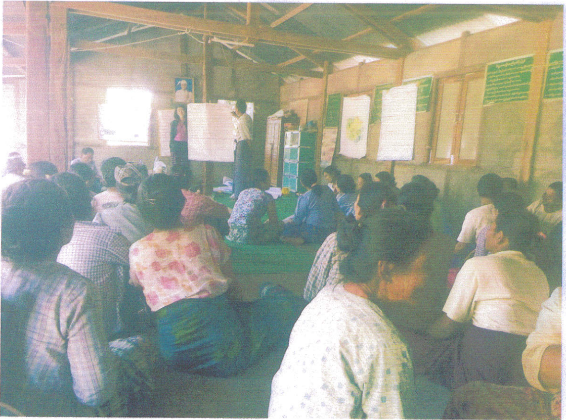
အမျိုးသားများ၏အခက်အခဲပြဿနာနှင့်မျှော်မှန်းချက်အားလွှဲပြောင်းနေပုံ