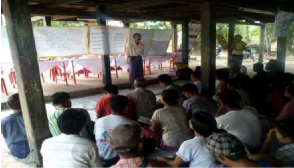
သာပေါင်းမြို့နယ်၊ ခတ္တိယကျေးရွာအုပ်စု၊ မဲဇလီကုန်းကျေးရွာတွင် PRA Toolsများပြုလုပ်ပုံ