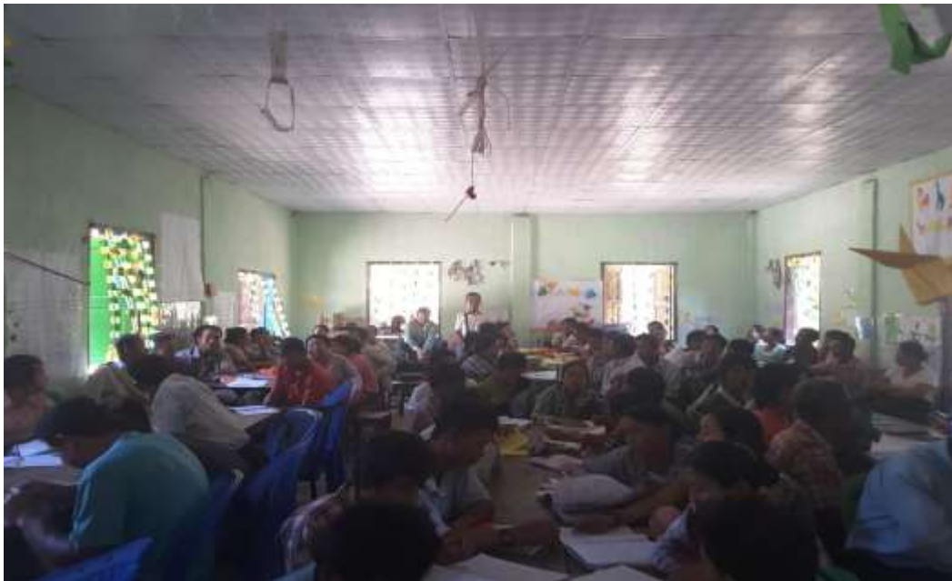
သာပေါင်းမြို့နယ်၊ ခတ္တိယကျေးရွာအုပ်စု၊ မဲဇလီကုန်းကျေးရွာတွင် အစည်းအဝေးပြုလုပ်ပုံ