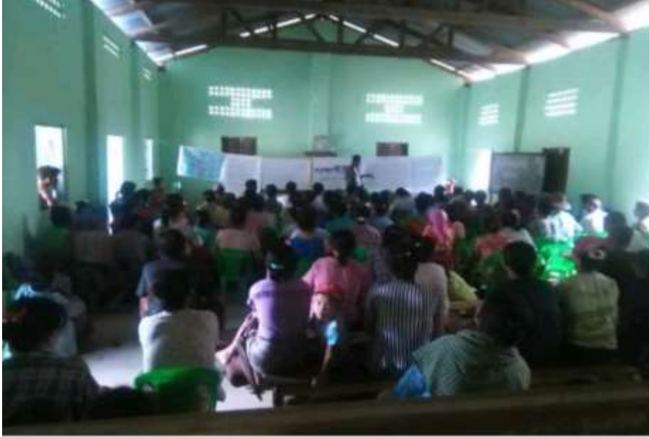
သာပေါင်းမြို့နယ်၊ ခတ္တိယကျေးရွာအုပ်စု၊ ကျွန်းကုန်းကျေးရွာတွင် PRA Tools များ ပြုလုပ်ပုံ