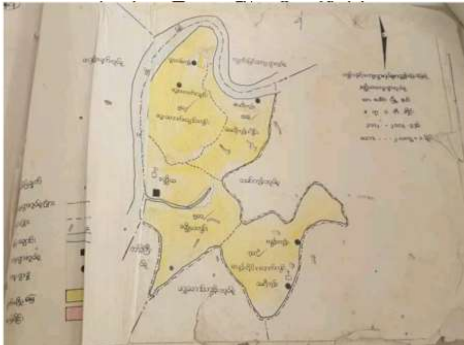
ဧရာဝတီတိုင်းဒေသကြီး၊ သာပေါင်းမြို့နယ်၊ ခတ္တိယကျေးရွာအုပ်စုအခြေပြမြေပုံ