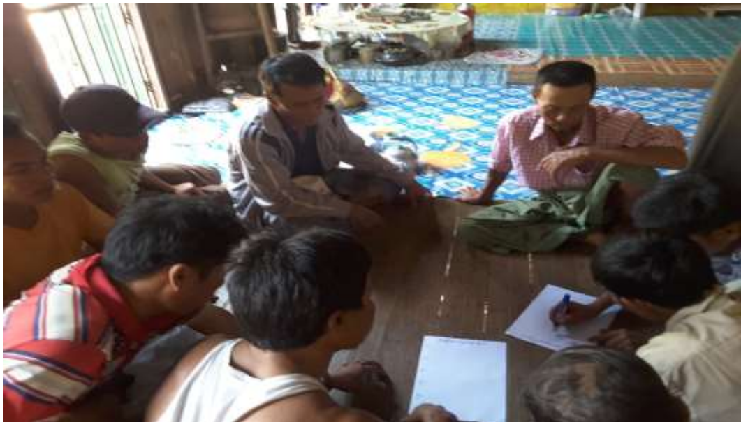
သာပေါင်းမြို့နယ်၊ ခတ္တိယကျေးရွာအုပ်စု၊ ကျွန်းကုန်းကျေးရွာတွင် အစည်းအဝေးပြုလုပ်ပုံ