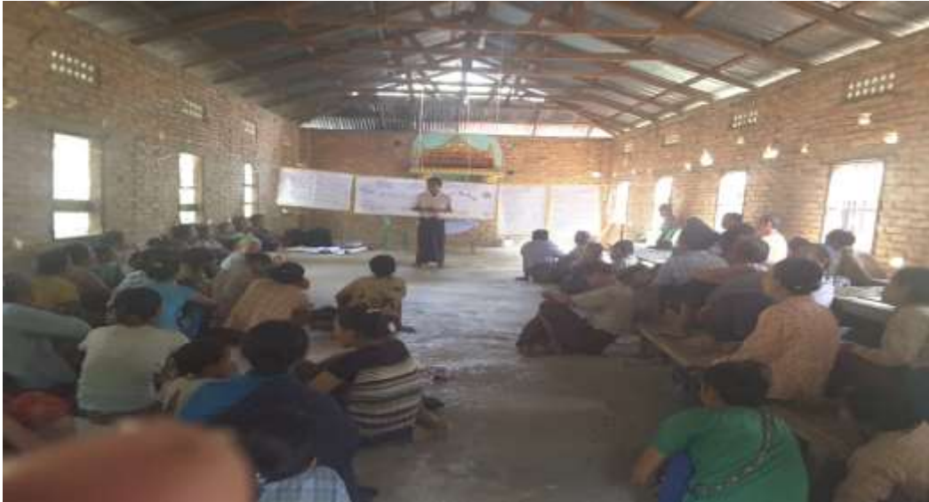
သာပေါင်းမြို့နယ်၊ ခတ္တိယကျေးရွာအုပ်စု၊ ကျွန်းကုန်းကျေးရွာတွင် PRA Tools များ ပြုလုပ်ပုံ