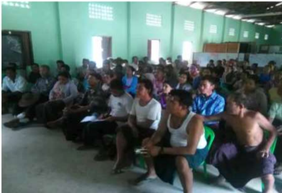
သာပေါင်းမြို့နယ်၊ ခတ္တိယကျေးရွာအုပ်စု၊ ကျွန်းကုန်းကျေးရွာတွင် PRA Toolများပြုလုပ်ပုံ