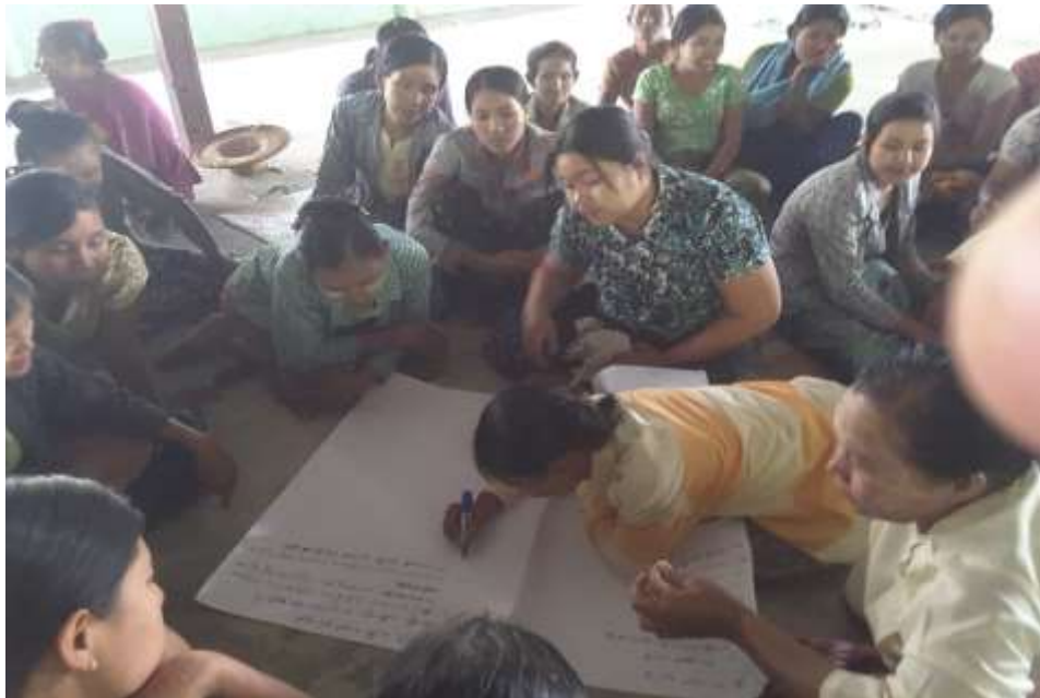
သာပေါင်းမြို့နယ်၊ ခတ္တိယကျေးရွာအုပ်စု၊ ငွေတောက်ချောင်းကျေးရွာတွင် အစည်းအဝေးပြုလုပ်ပုံ