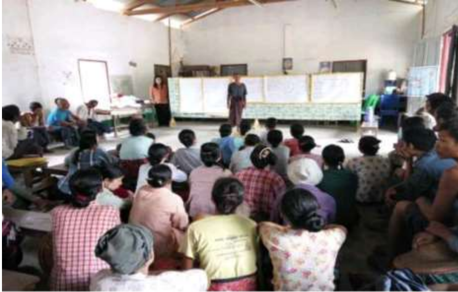
သာပေါင်းမြို့နယ်၊ ခတ္တိယကျေးရွာအုပ်စု၊ ငွေတောက်ချောင်းကျေးရွာတွင် PRA Tools များ ပြုလုပ်ပုံ