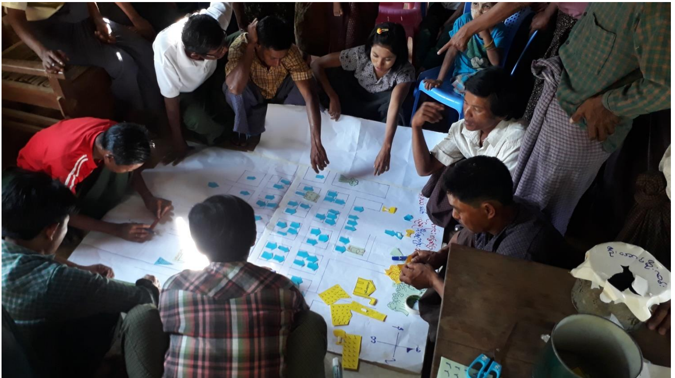
ပုံ.....PRA လုပ်ငန်းစဉ်များပြုလုပ်နေပုံ