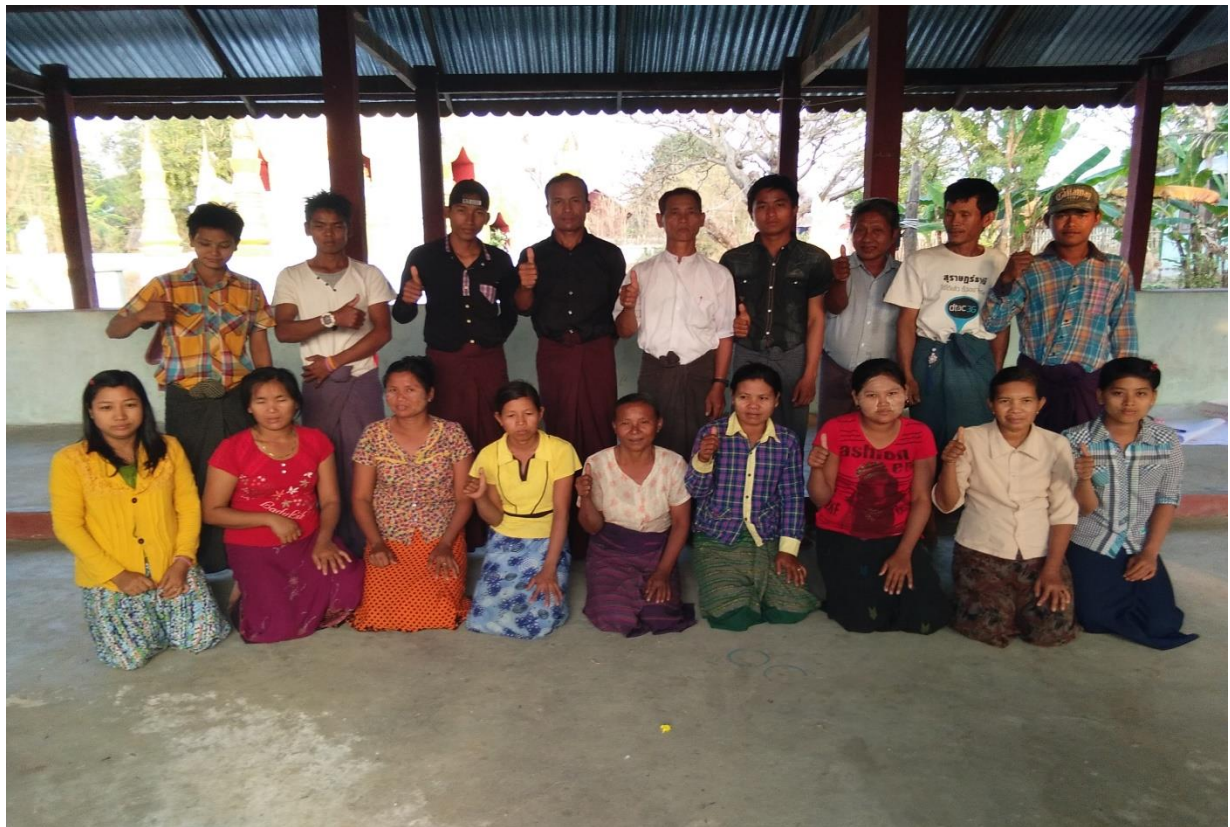
ပုံ..... ကျေးရွာစီ-ထောက် ကော်မတီအဖွဲ့.