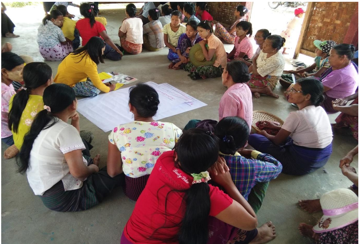
ပုံ...PRA လုပ်ငန်းစဉ်များပြုလုပ်နေပုံ