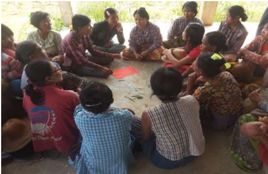
သာပေါင်းမြို့နယ်၊ ကွက်ပြင်ကျေးရွာအုပ်စု၊ ကွမ်းခြံစုကျေးရွာတွင်အစည်းအဝေး ကျင်းပပြုလုပ်ပုံ