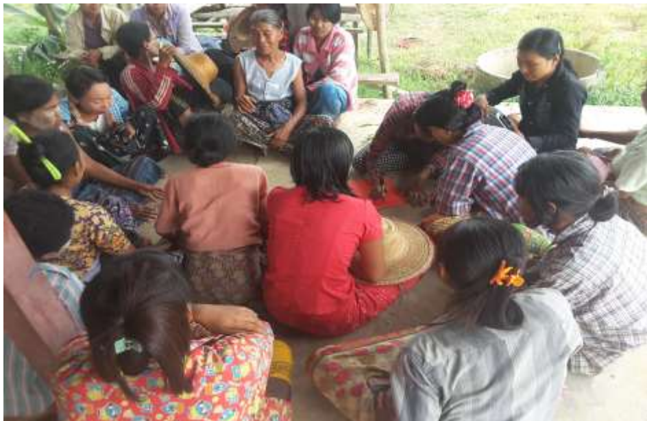
သာပေါင်းမြို့နယ်၊ ကွက်ပြင်ကျေးရွာအုပ်စု၊ ကွမ်းခြံစုကျေးရွာတွင် PRA Toolsများ ပြုလုပ်ပုံ