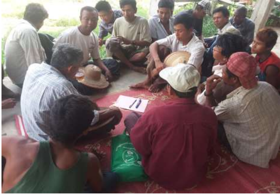
သာပေါင်းမြို့နယ်၊ ကွက်ပြင်ကျေးရွာအုပ်စု၊ ကွမ်းခြံစုကျေးရွာတွင် PRA Toolsများ ပြုလုပ်ပုံ