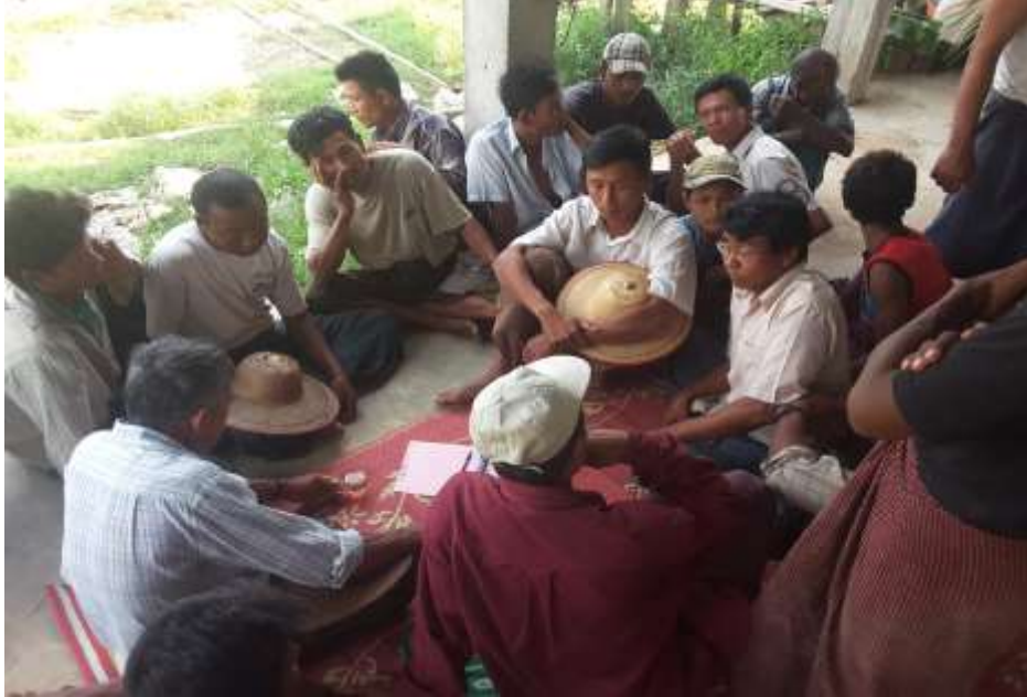
သာပေါင်းမြို့နယ်၊ ကွက်ပြင်ကျေးရွာအုပ်စု၊ ကွမ်းခြံစုကျေးရွာတွင် PRA Toolsများပြုလုပ်ပုံ