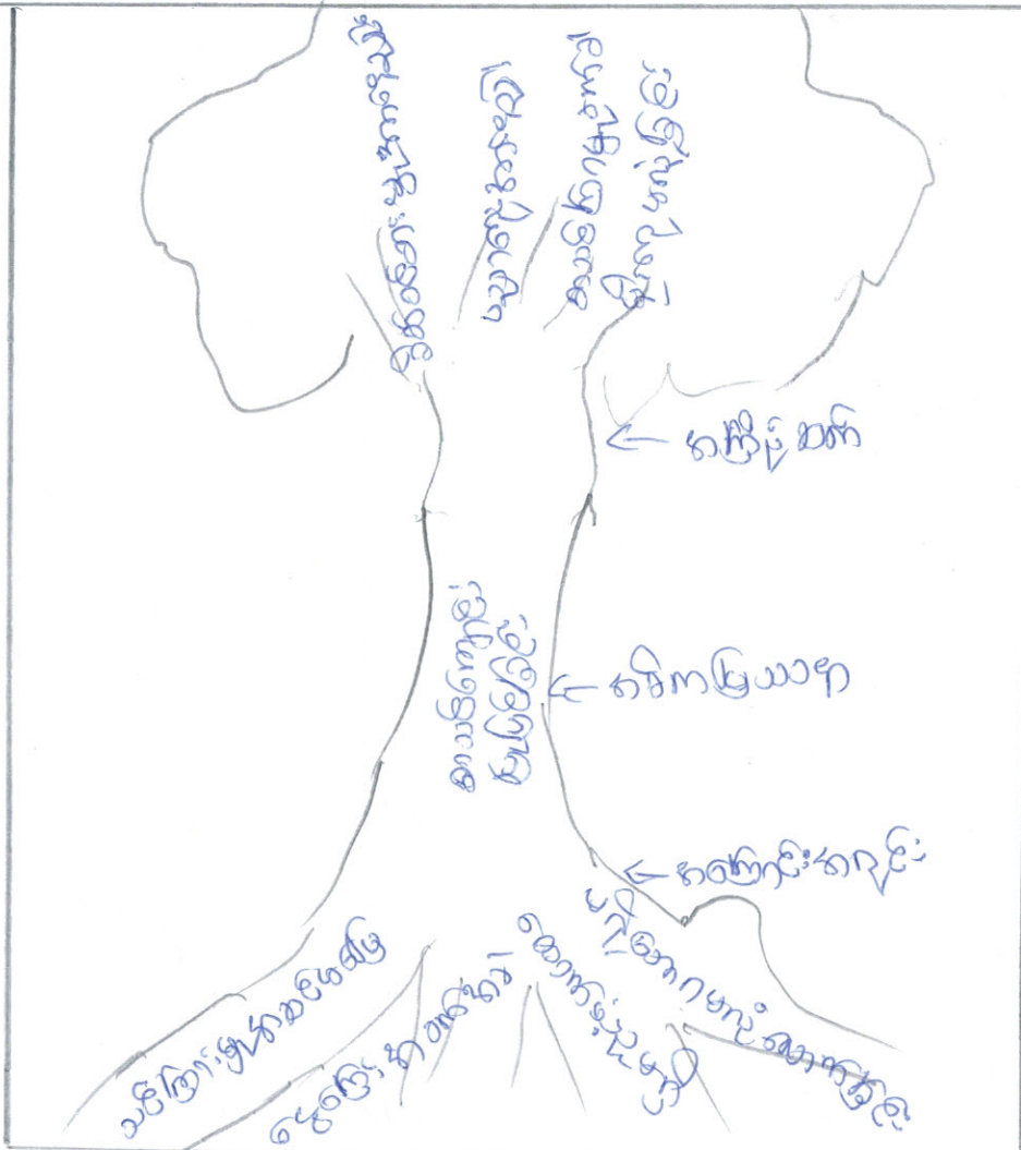
කුරුම මාර්ගයේ ප්‍රධාන මාර්ග (කොළඹ මාර්ගය + කොළඹ මාර්ගය)