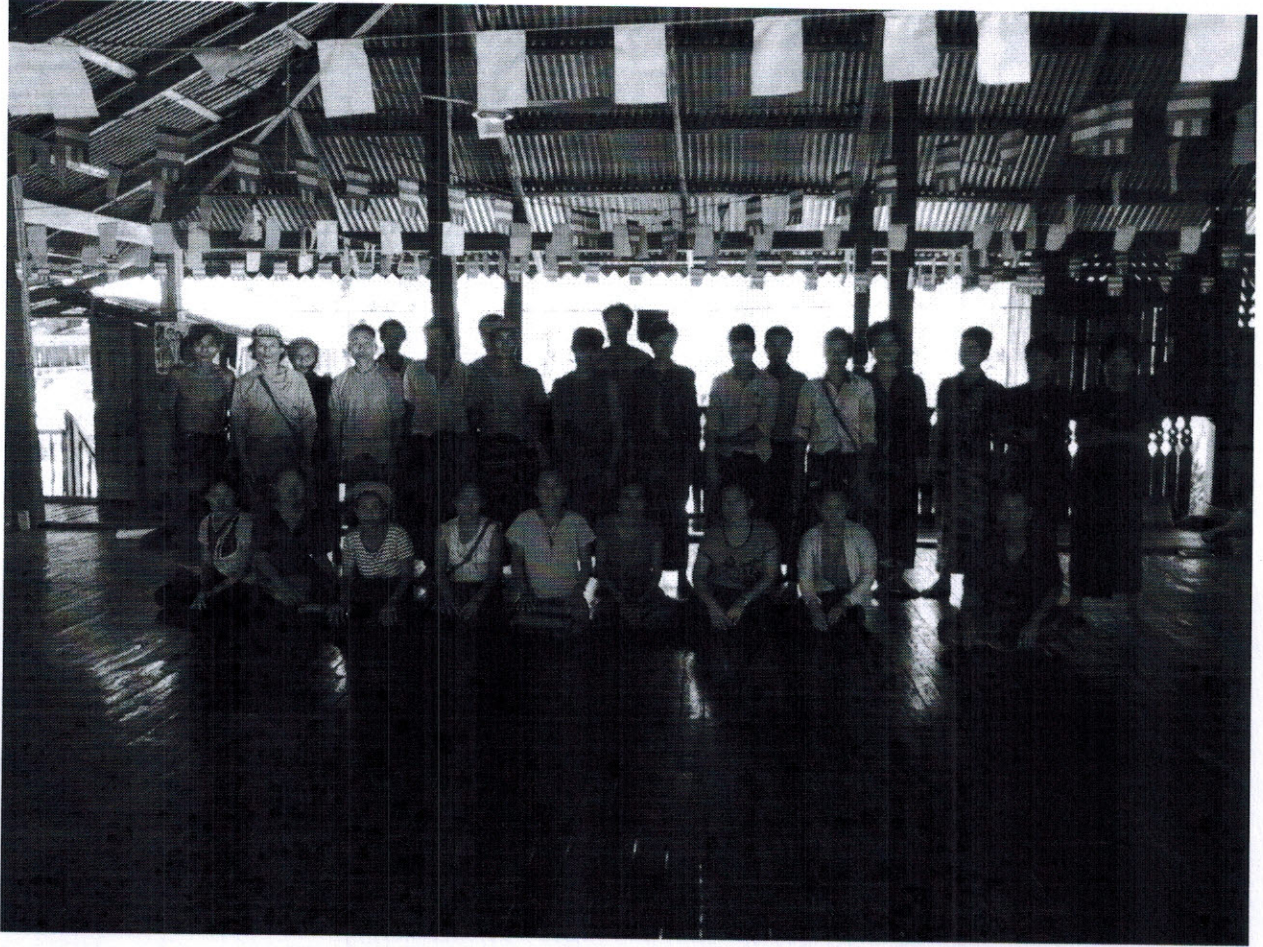
ကျေးရွာဖွံ့ဖြိုးရေးအစီအစဉ်ဆောင်ရွက်မှုမှတ်တမ်းဓါတ်ပုံများ