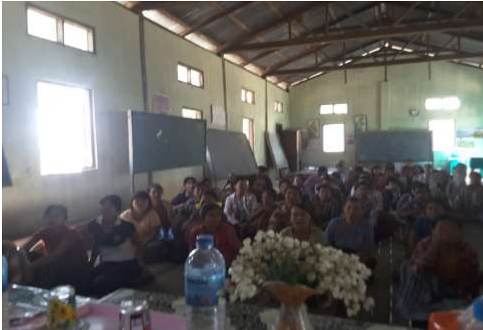
သာပေါင်းမြို့နယ်၊ မီးသွေးတိုက်အုပ်စုအလယ်ကျွန်းကျေးရွာ တွင် PRA Tools များ ပြုလုပ်ပုံ