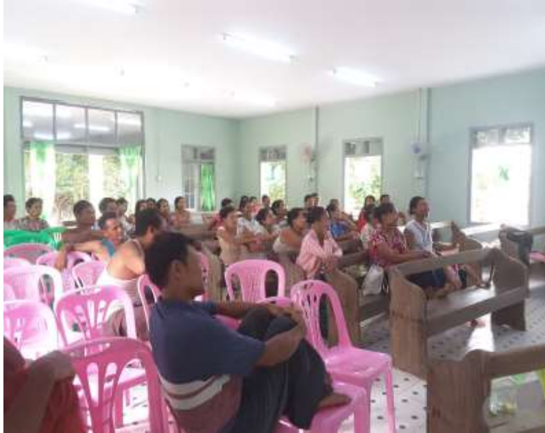
သာပေါင်းမြို့နယ်၊မီးသွေးတိုက်အုပ်စု၊မီးသွေးတိုက်ကျေးရွာ PRA Toolsများပြုလုပ်ပုံ