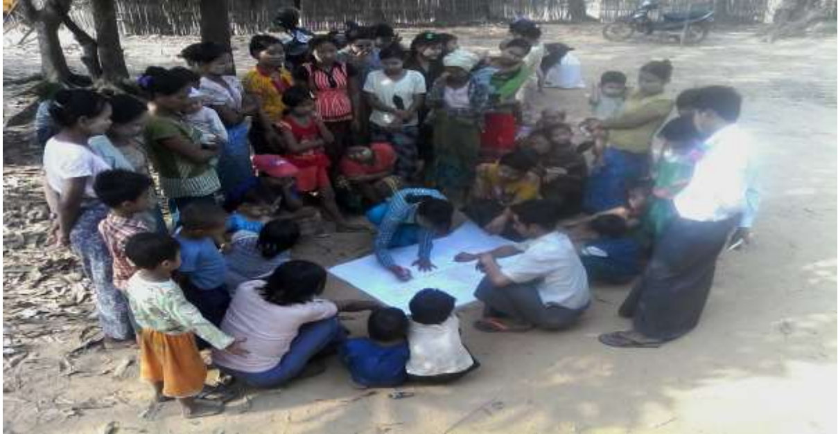
သာပေါင်းမြို့နယ်၊ လှေကြီးတက်အုပ်စု။ တပ်ကုန်းကျေးရွာတွင် PRA Tools များ ပြုလုပ်ပုံ